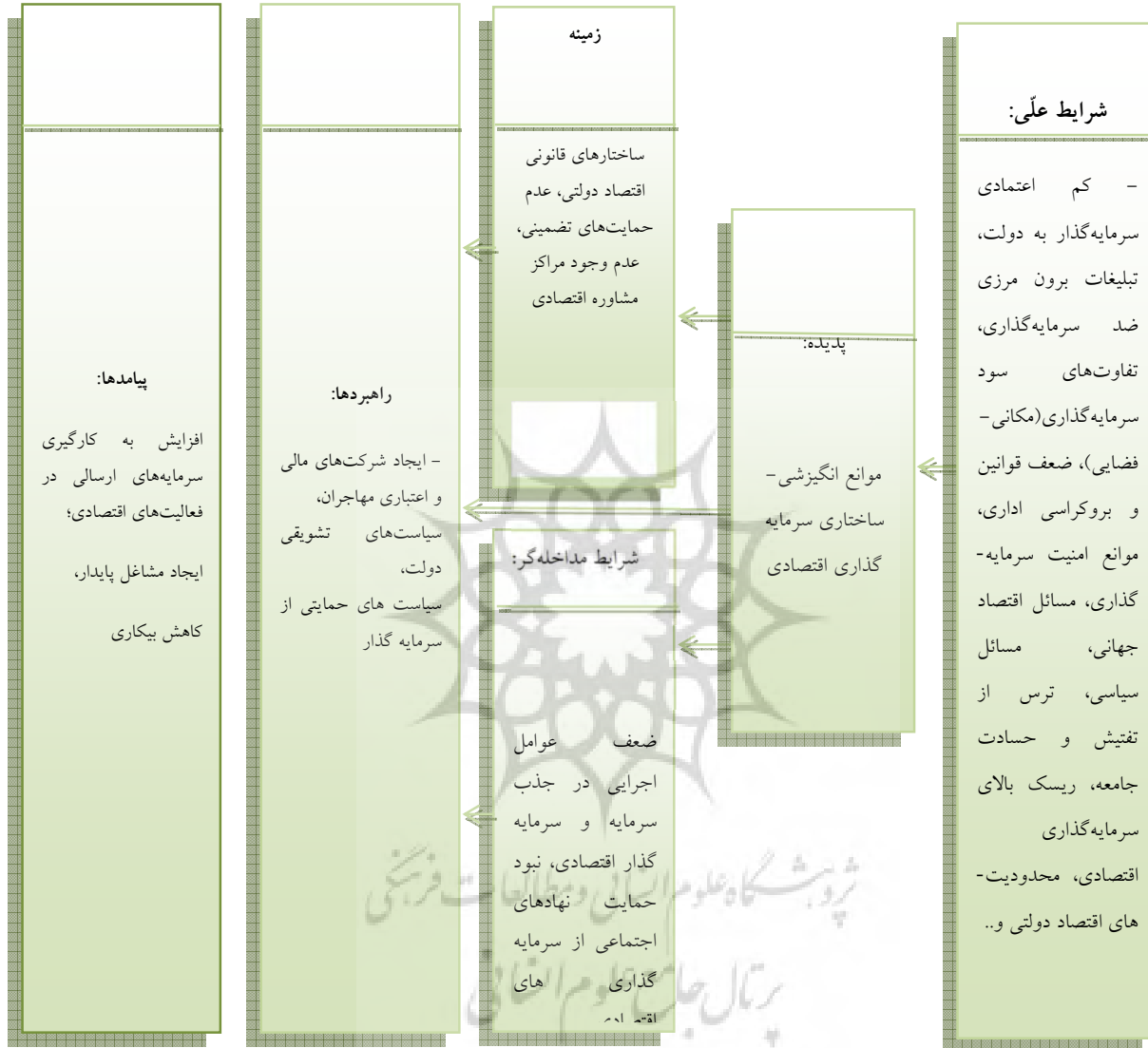
شکل ۲. مدل کانونی پژوهش