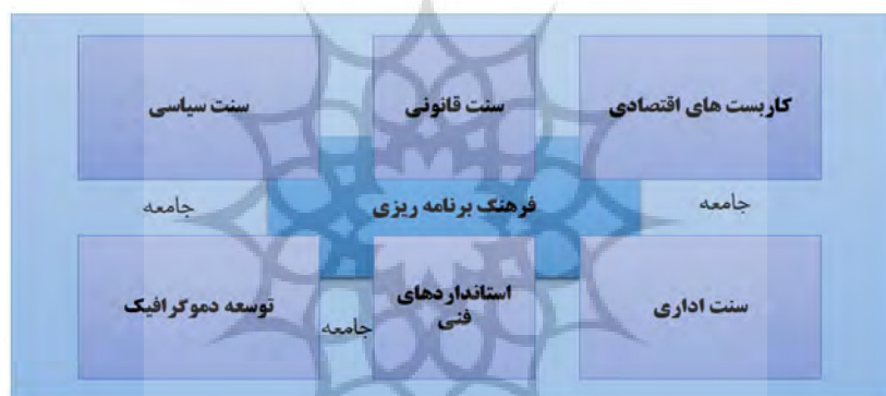
شکل ۲. حکم‌شدگی فرهنگ برنامه‌ریزی

برنامه‌ریزی، فرایندهای توسعه و تصمیم‌سازی در کل متأثر از بستر فرهنگی مردم و جامعه هستند. درک و کاربست متفاوت برنامه‌ریزی و توسعه‌ی شهری و منطقه‌ای مبتنی بر زمینه‌ی قانونی و فرهنگی آن‌ها بوده و از این‌روست که کاربست برنامه‌ریزی شهری و منطقه‌ای در بین کشورها و مناطق مختلف به‌طور قابل ملاحظه‌ای تغییر می‌کند؛ در نتیجه فرهنگ برنامه‌ریزی تنها در ابزارها و روندهای برنامه‌ریزی خلاصه نشده و در درون ساختارهای نهادی و سیاسی-اداری و نیز سنت‌ها و مدل‌های فرهنگی و اقتصادی نیز ریشه دوانده است؛ بنابراین فرهنگ برنامه‌ریزی تحت تأثیر سنت‌های اداری، سیاسی و قانونی و توسعه‌های جاری، کاربست‌های فنی و اقتصادی و توسعه‌ی دموگرافیک و نیز سنت‌های اجتماعی، ارزش‌ها، نگرش‌ها و جنبش‌ها یا تغییرات اجتماعی معاصر است (شکل ۲) (Knieling & Sanyal, 2005: 13) Othengrafen, 2009: 43;