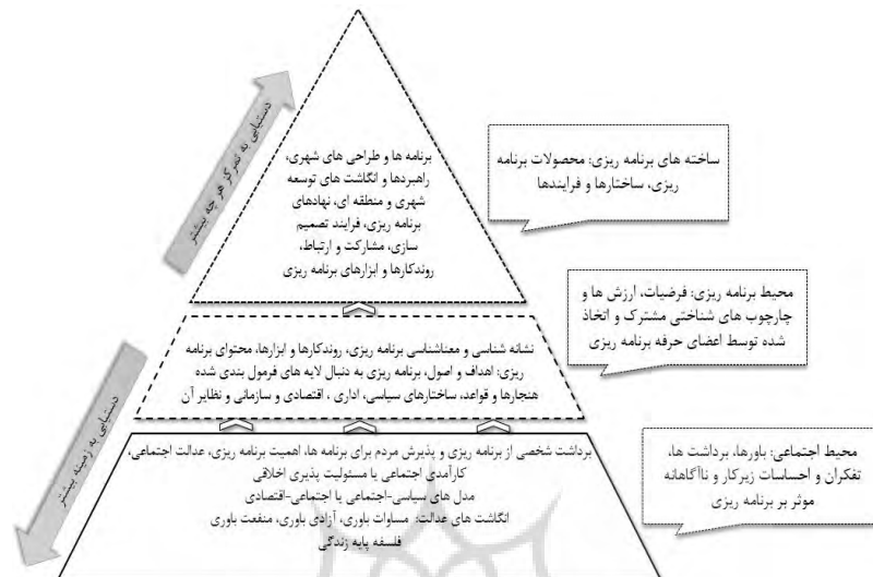
شکل ۳. مدل برنامه‌ریزی مبتنی بر فرهنگ: نمایش فرهنگ و اثرات آن بر برنامه‌ریزی و توسعه‌ی فضایی