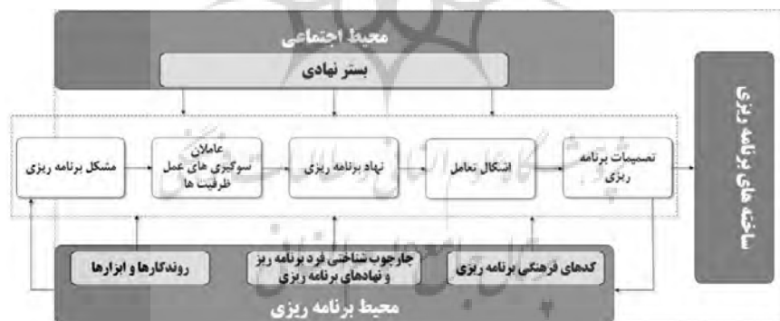
شکل ۴. مدل برنامه‌ریزی مبتنی بر فرهنگ مبتنی بر رهیافت نهادباوری عامل-مدار

جنبه‌ی ساختاری/ نهادی و کنش‌گر/ عاملیت را توأمان در نظر گیرد. افزون بر سهولت عملیاتی- سازی، این رهیافت فرض بر انتخاب عقلانی و در نتیجه چارچوب رفتاری برای انگاشت‌پردازی روابط بین ساختار و عاملیت دارد. در این رهیافت می‌توان فرایند برنامه‌ریزی را به‌عنوان تعاملی بین فرد برنامه‌ریز و عاملان درگیر در فرایند برنامه‌ریزی با مهارت‌ها، منافع و سوءگیری‌های خاص خود در یک بستر نهادی و تحت شرایط سیاسی-اجتماعی به حساب آورد (Scharpf, 1997). با نظر به رهیافت نهادباوری عامل- مدار، تعاملات بین افراد و گروه‌ها در اصل و نهاد هر فرهنگی نهفته است و از این‌رو می‌توان نتیجه گرفت که برنامه‌ریزی فضایی به‌عنوان یک انتظام یا خرده‌فرهنگ، یک جامعه‌ی مبتنی بر تعاملات بین فرد برنامه‌ریز و عاملان درگیر در فرایند برنامه‌ریزی است. چنین تعاملاتی مبتنی بر بستر نهادی و محیط برنامه‌ریزی بوده و تمامی عاملان درگیر به‌واسطه‌ی چارچوب‌های شناختی و کدهای فرهنگی تحت تأثیر قرار می‌گیرند. هنجارها، باورها و برداشت‌های اجتماعی بسیاری وجود دارند که بر چارچوب شناختی برنامه-ریزان به‌واسطه‌ی شکل‌دهی پس‌زمینه‌ی خاص اجتماعی آن‌ها تأثیرگذار هستند. رهیافت حاضر با در نظر گرفتن عاملان برنامه‌ریزی و ساختار تأثیرگذار بر رفتار این عاملان، چارچوبی برای تحلیل فرهنگ برنامه‌ریزی فراهم می‌آورد که در آن بستر نهادی در چارچوب محیط اجتماعی و کدهای فرهنگی، چارچوب شناختی-برنامه‌ریزان و نهادهای برنامه‌ریزی- و روندکارها و ابزارهای برنامه‌ریزی در چارچوب محیط برنامه‌ریزی لحاظ شده‌اند (شکل ۴).