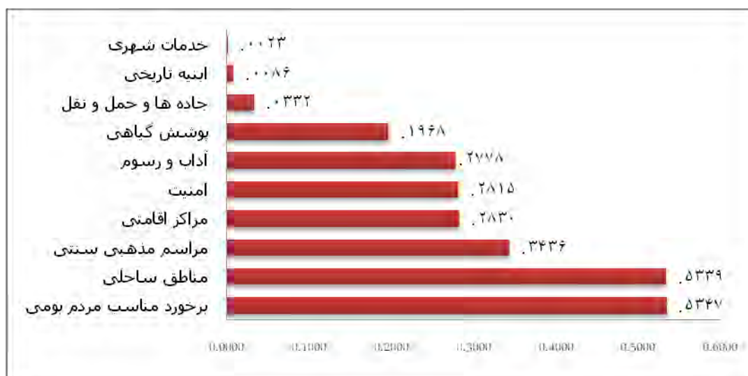
شکل ۲. رتبه‌بندی و سطح‌بندی وضعیت پارامترهای مربوط به توسعه یافتگی شهر بوشهر