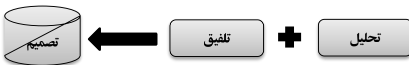
شکل ۱. فرایند تصمیم‌گیری

با توجه به آن چه گفته شد، رضایت شغلی سالمندان در پی انتخاب درست و مناسب حاصل می‌شود. در این پژوهش به بررسی کیفی عوامل رضایتمندی و یا عدم رضایتمندی شغلی سالمند با توجه به الگوی چندمحوری شفیع آبادی از طریق مصاحبه با رویکرد روایت درمانی در بستر فرهنگی ایرانی و اسلامی می‌پردازیم. بنابراین سوال اصلی این پژوهش این است که عوامل رضایت و یا عدم رضایت شغلی سالمند با توجه به تجربه زیسته دوران شغلی طی شده کدامند؟ در ضمن این تحقیق مساله ترتیب اولویت های سالمند برای انتخاب شغل نیز مورد تحلیل واقع می‌شود و محورهای الگوی شفیع آبادی در فرهنگ ایرانی اسلامی بیان، تقدم و تاخر جدیدی پیدا می‌کنند.