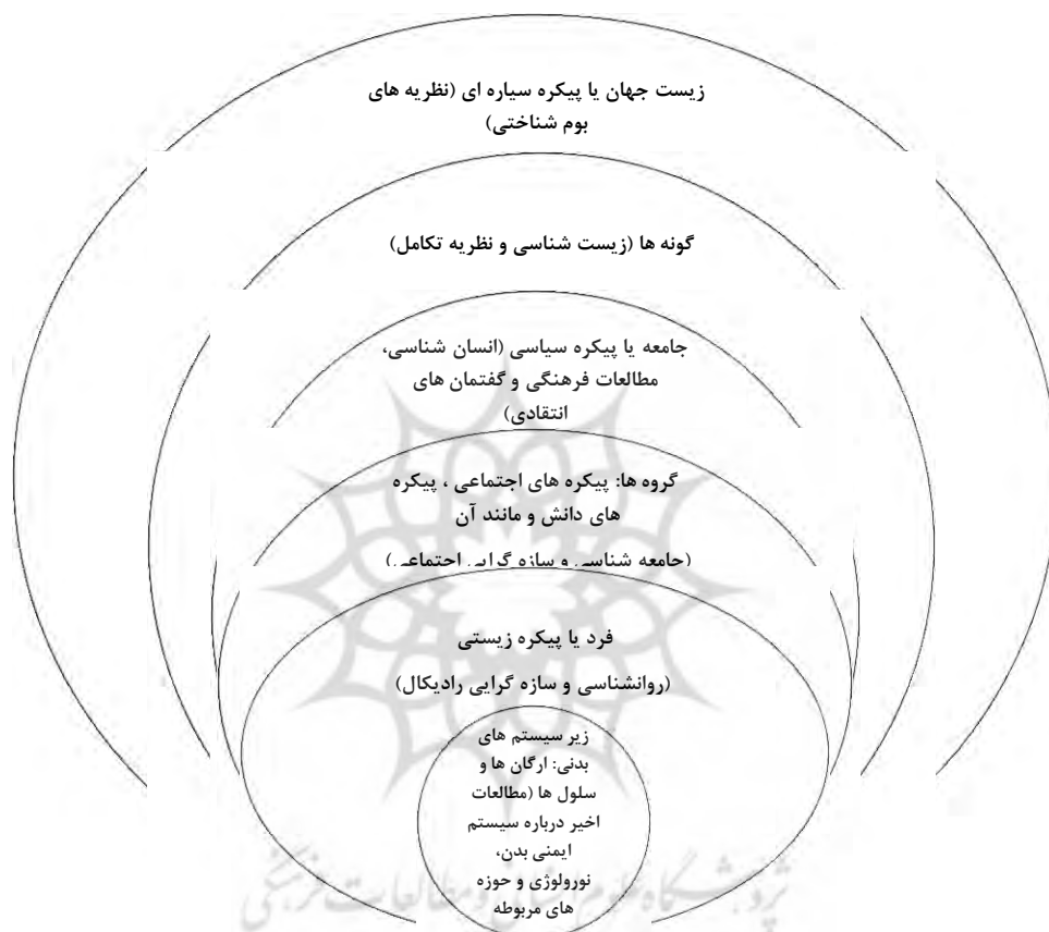
شکل ۲: قلمرو یادگیری در پارادایم پیچیدگی

از نظر دال ۲ ، یادگیرنده واحدی پیچیده است که قادر به سازگار کردن خود با انواع وضعیت‌های جدید و مختلف می‌باشد و مانند یک عامل فعال در مواجهه با جهان پویاست. در دیدگاه‌های سنتی و مدرن، یادگیرنده یک فرد مجزا و منفرد محسوب می‌شود، اما در این دیدگاه، یادگیرندگان علاوه بر افراد