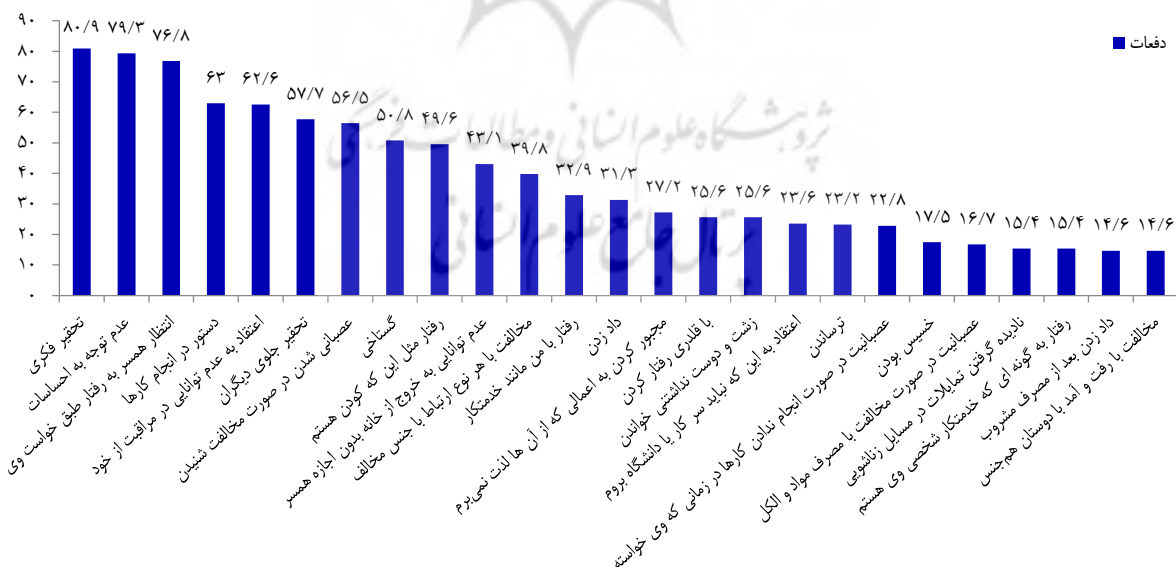
شکل ۲. فراوانی انواع خشونت غیر فیزیکی

رگرسیون خطی نشان داد که از بین متغیرهای مرتبط با سوء رفتار، طول مدت سوء رفتار، سابقه خشونت فیزیکی و شدت سوء رفتار غیر فیزیکی رابطه معنی داری با دفعات اقدام به خودکشی داشت. این سه متغیر توانستند حدود ۱۹ درصد دفعات اقدام به خودکشی را تبیین نمایند. با هر واحد افزایش انحراف معیار سوء رفتار فیزیکی، ۰/۳۷ درصد شانس اقدام به خودکشی افزایش یافت. همچنین، با هر بار افزایش انحراف معیار شدت خشونت غیر فیزیکی، ۰/۲۰ درصد احتمال اقدام به خودکشی افزایش پیدا کرد و با طولانی شدن مدت سوء رفتار نیز این احتمال ۰/۱۹ درصد بالا رفت (جدول ۳).