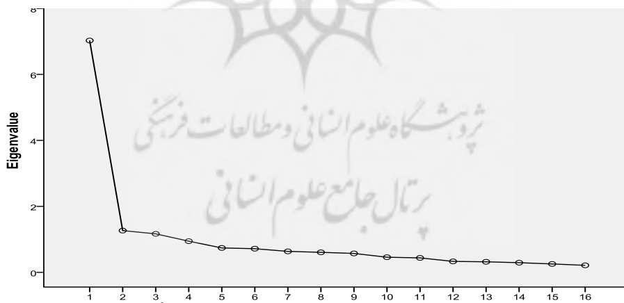
نمودار ۲. آزمون اسکری آسیب‌های روانی جنگ نرم

تحلیل عوامل مربوط به آسیب‌های روانی جنگ نرم به کمک آزمون اسکری در نمودار ۲ نیز ارائه شده است.