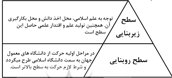
شکل شماره ۱- سطوح تحلیل اسلامی شدن دانشگاه (حسن، ۲۰۱۵)

خلاصه می‌توان گفت در دانشگاه اسلامی عالم علم را به عنوان وسیله‌ای برای تکامل روحی و طی درجات الهی و سیر و سلوک مورد استفاده قرار می‌دهد و علم در چنین دانشگاهی، صبغه الهی دارد نه رنگ مادی و استقلال آور است نه مرعوب پرور (دین و جانجوا، ۲۰۱۵).