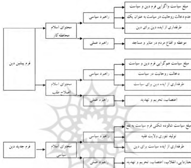
شکل شماره (۲). الگوی تحلیلی پژوهش

رئیس‌جمهور امریکا بدانند که منفورترین افراد بشر پیش ملت ما است (خمینی، ۱۳۷۳: ۴۱۱).