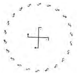
(صفارزاده، ۱۳۶۸: ۶۱)