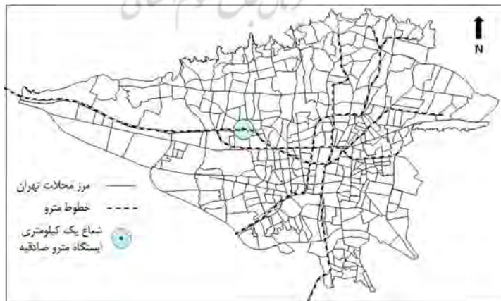
شکل ۱: موقعیت ایستگاه مترو صادقیه در سطح شهر تهران

در شکل (۱) موقعیت ایستگاه مترو صادقیه در شهر تهران مشخص شده است. توزیع ساعتی مسافر ایستگاه صادقیه در یک هفته از شهریور ماه ۱۳۹۴ مطابق با شکل (۲)، حاکی از آن است که بیشترین تعداد سفرها در فاصله ساعت‌های ۸ تا ۹ صبح قرار دارد، به‌طوری‌که سفرهای در این بازه زمانی به‌طور معمول با هدف کار و آموزش و به تبع اجباری است.