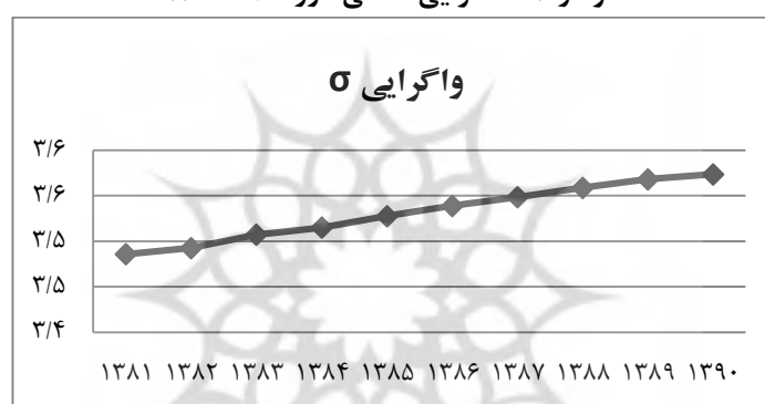
نمودار ۲. همگرایی \sigma طی دوره ۹۰-۱۳۸۰

همان‌طور که گفته شد، در کنار همگرایی \beta نوع دیگری از همگرایی در ادبیات نظری و تجربی مدل رشد مطرح است که به نام همگرایی \sigma مشهور می‌باشد. به منظور بررسی همگرایی \sigma بهره‌وری انرژی طی دوره زمانی ۹۰-۱۳۸۰، انحراف معیار لگاریتم بهره‌وری انرژی در هر سال برای ۲۸ استان محاسبه و در نمودار ۱ رسم شد. مشاهده می‌شود که طی سالهای مورد بررسی، انحراف معیار لگاریتم بهره‌وری انرژی استان‌ها افزایش یافته، که نشان‌دهنده واگرایی \sigma آنها است.