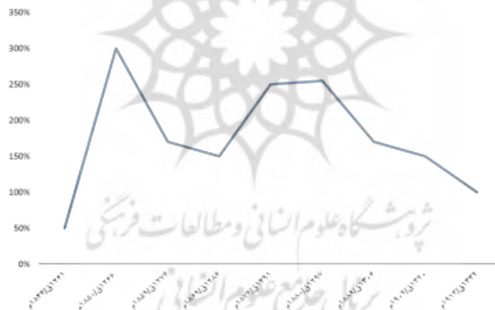
نمودار ۱: میزان نوسانات تجارت شال در دوره قاجار

تحلیل و بررسی‌های انجام شده نشان از آن دارد که صنعت شالبافی در برخی از مواقع زمینه‌آزآوری برای کشور مهیا می‌کرد و در برخی مواقع دیگر با کاهش تولید و در نتیجه واردات شال از کشورهای دیگر همراه بود. بدین گونه می‌توان نتیجه گرفت که اقتصاد شال جز در مقاطعی که رشد چشمگیری به همراه داشت به دلایل متعددی که بیان شد با رکود مواجه بود. علاوه بر این، نمودار زیر می‌تواند گویای روند صعودی و نزولی تجارت شال در دوره‌ی قاجار باشد. این نمودار تجارت شال را در فاصله سال‌های ۱۲۶۱ق/۱۸۴۴م تا ۱۳۳۲ق/۱۹۱۳م نمایان می‌سازد.