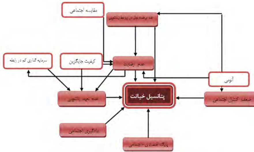
مدل تحلیلی تحقیق