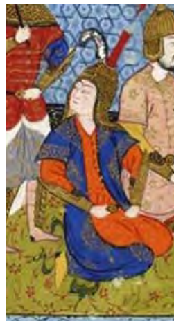
تصویر ۳. کلاه قزلباشی در نگاره‌های شاهنامه فردوسی کتابخانه ملی پاریس، ۹۵۳ق. ۱