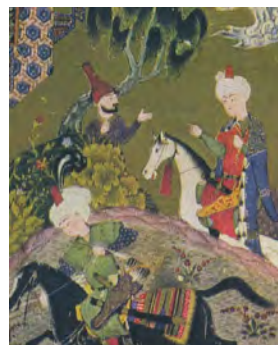
تصویر ۲. کلاه قزلباشی در نگاره‌های مثنوی جلال و جمال، مکتب تبریز، ۹۰۹-۹۱۰ ق.