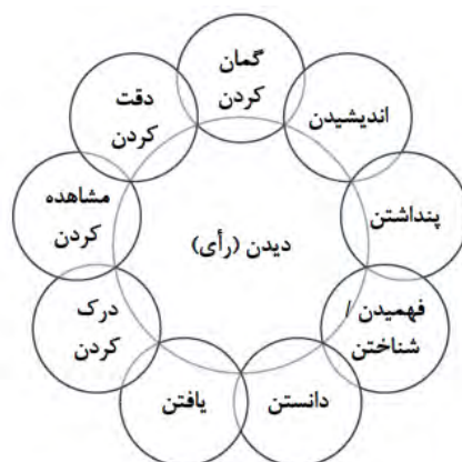
(شکل شماره ۲)

نکته مهمی که در نمودار فوق وجود دارد؛ ارتباطی است که میان قالب‌های معنایی فرعی و قالب معنایی مرکزی یعنی دیدن با چشم سر است. درحقیقت، لازمه شکل‌گیری قالب‌های معنایی جدید، دیدن با چشم سر است. حتی می‌توان دیدن با چشم را در ذهن تصور کرد و به‌گونه‌ای با مسائل پیرامون، برخورد کرد که گویی قابل دیدن هست. یکی از معادل‌هایی که برای فعل «رأی» در فرهنگ لغت گفته شده، «رأی أن» است. نمودار زیر نشان می‌دهد که فعل «رأی» در زبان عربی با همراه‌شدن با حرف «أن» در برگردان فارسی، قالب معنایی تازه‌ای را به قالب معنایی مرکزی اضافه می‌کند.