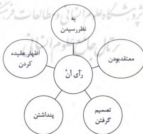
(شکل شماره ۳)

نکته مهمی که در نمودار فوق وجود دارد؛ ارتباطی است که میان قالب‌های معنایی فرعی و قالب معنایی مرکزی یعنی دیدن با چشم سر است. درحقیقت، لازمه شکل‌گیری قالب‌های معنایی جدید، دیدن با چشم سر است. حتی می‌توان دیدن با چشم را در ذهن تصور کرد و به‌گونه‌ای با مسائل پیرامون، برخورد کرد که گویی قابل دیدن هست. یکی از معادل‌هایی که برای فعل «رأی» در فرهنگ لغت گفته شده، «رأی أن» است. نمودار زیر نشان می‌دهد که فعل «رأی» در زبان عربی با همراه‌شدن با حرف «أن» در برگردان فارسی، قالب معنایی تازه‌ای را به قالب معنایی مرکزی اضافه می‌کند.