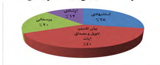
نمودار ساختارهای بیانی روایات تفسیری اصیغ

تعداد دیگری از روایات نیز با بهره‌گیری از آیات قرآن در مقام ارشاد و هدایت شیعیان و یا تشویق و تمجید آنها به یک موضوع خاص است (ارشادی، ۱۲)، طبیعی است می‌بایست میان هر یک از این حالات که هر کدام بستری ویژه برای صدور روایت بشمار می‌آید، فرق نهاد. به‌طور مشخص هر یک از این‌گونه‌ها در دل خود پیام ناپیدایی دارد که نیازمند تحلیل، بررسی و کشف است و در بخش‌های بعدی مورد کاوش بیشتر قرار خواهد گرفت.