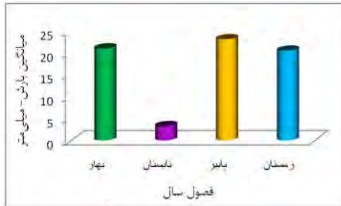
شکل ۳- میانگین بارش صورت گرفته در حوضه آبخیز شاهرود طی فصول سال پایه.