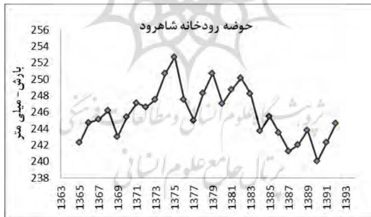
شکل ۲- الگوی رفتاری بارش در حوضه آبخیز شاهرود طی دوره مورد بررسی.