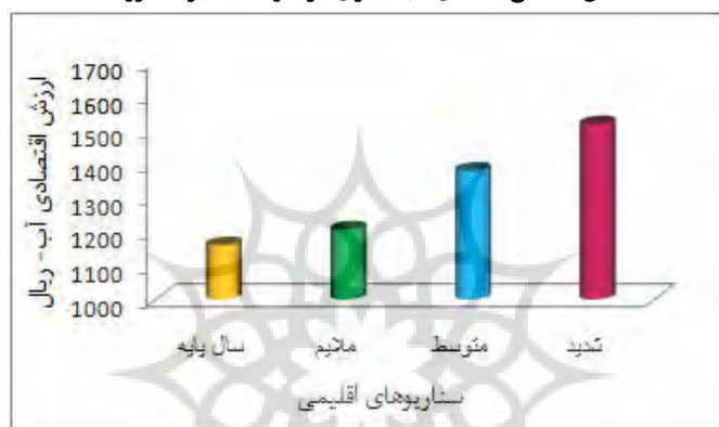
شکل ۶- تغییرات ارزش اقتصادی آب آبیاری در سناریوهای اقلیمی.