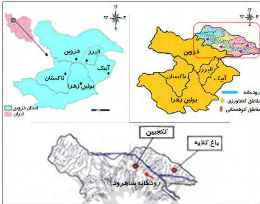
شکل ۱- موقعیت حوضه رودخانه شاهرود و ایستگاه‌های هواشناسی مورد مطالعه در آن.