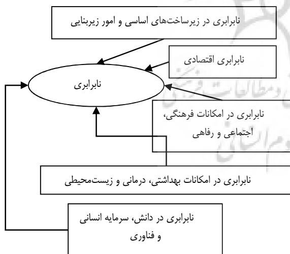
شکل ۱ ابعاد مختلف اثرگذار بر نابرابری منطقه‌ای

بررسی نظریات حوزه نابرابری منطقه‌ای، بیانگر وجود نگاه چند بُعدی در سنجش نابرابری منطقه‌ای است، به گونه‌ای که اهمیت هر یک از این ابعاد کمتر از بُعد دیگر نخواهد بود. ابعاد مختلف مؤثر بر نابرابری منطقه‌ای را می‌توان به صورت زیر نشان داد (شکل ۱). این ابعاد، تمامی نماگرهای مختلف مطرح شده در ادبیات نظری این حوزه را در برمی‌گیرد.