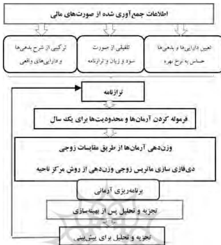
شکل (۱) مراحل انجام پژوهش