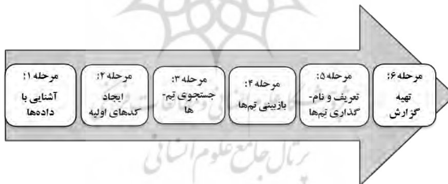
شکل ۱. فرایند و گام‌های روش تحلیل تم (براون و کلارک، ۲۰۰۶)

برای گردآوری داده‌ها از مصاحبه استفاده شده است و تحلیل داده‌ها با استفاده از تحلیل تم صورت گرفته است. تحلیل تم ۱ روشی برای تعیین، تحلیل و بیان الگوهای (تم‌ها) موجود درون داده‌هاست. مراحل شش‌گانه روش تحلیل تم که در این پژوهش به کار گرفته شده است، در شکل (۱) قابل مشاهده است.