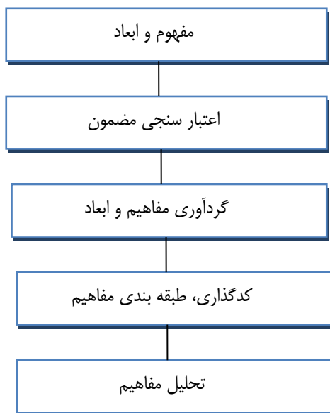
شکل ۱. فرایند انجام پژوهش