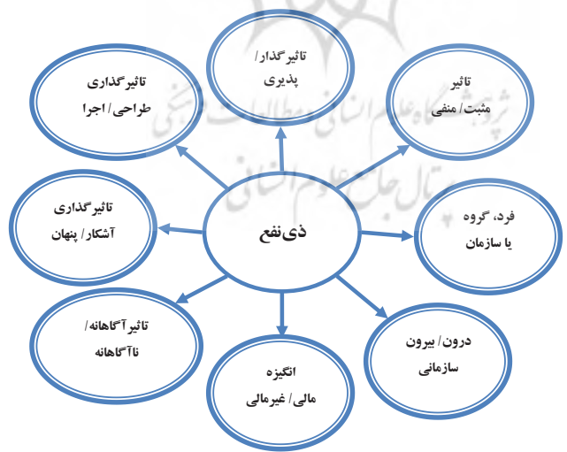
شکل ۱: دسته‌بندی انواع ذی‌نفعان

تأثیرات اجتماعی، می‌توان بر مخالفان و موانع آن سیاست غلبه کرد، ائتلاف تشکیل داد و منابع و مسیر ارتباطی را برای تقویت و پایداری پیشنهادهای سیاستی تجهیز کرد. یکی از مهم‌ترین پرسش‌های روش‌شناختی در تحلیل ذی‌نفعان این است که ذی‌نفع به چه کسی گفته می‌شود؟ عقاید متفاوتی راجع به اینکه ذی‌نفعان دقیقاً چه کسانی هستند وجود دارد. بسیاری از تعاریف اخیر ذی‌نفعان بر پایه پژوهش‌های فریمن (۱۹۸۴) در زمینه تئوری ذی‌نفعان شکل گرفته است. بر این اساس، ذی‌نفعان شامل هر فرد یا گروهی هستند که به‌طور موثر تحت تأثیر فعالیت‌های سازمانی قرار گرفته یا می‌توانند فعالیت‌های سازمانی را تحت تأثیر قرار دهند. تحلیل ذی‌نفعان به‌عنوان فرآیندی شناخته می‌شود که به واسطه آن، وجوهی از پدیده‌های طبیعی و اجتماعی که به‌وسیله یک عمل یا تصمیم تحت تأثیر واقع می‌شوند، تعیین شده و همچنین افراد، گروه‌ها و سازمان‌هایی که تحت تأثیر وجوه یادشده قرار داشته یا این وجوه را تحت تأثیر قرار می‌دهند نیز شناسایی می‌شوند. از طریق این تحلیل، تضادهای موجود بین ذی‌نفعان شناسایی می‌شوند. از طریق این تضادها فعالیت‌های بعدی تشدید نمی‌شوند روش‌های مختلف تحلیل ذی‌نفعان به‌طور عمده دربرگیرنده سه مرحله عمومی شناسایی ذی‌نفعان، اولویت‌بندی ذی‌نفعان و مشارکت دینفعان است (Chevalier & Buckles, 2008). در شکل (۱) دسته‌بندی انواع ذی‌نفعان بر اساس معیارهای مختلف نشان داده شده است.