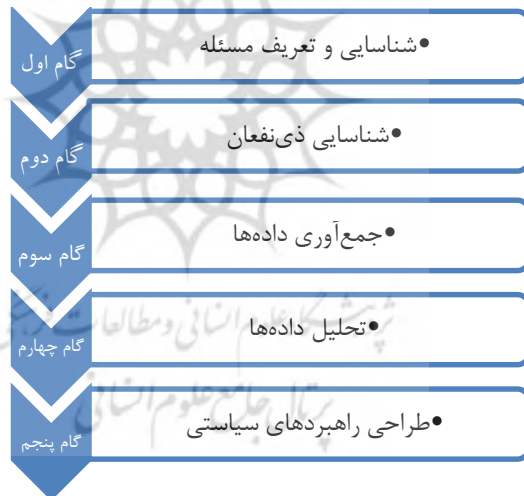
شکل ۲: گام‌های انجام تحلیل ذی‌نفعان

تبیین روش‌شناسی تحلیل ذی‌نفعان مستلزم این است که فرآیند انجام پژوهش بر اساس روش تحلیل ذی‌نفعان از دیدگاه یک پژوهشگر ترسیم شود. بر این اساس می‌توان شکل (۲) را ترسیم کرد.