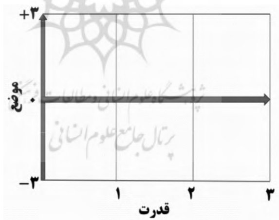
ماتریس ۴: ماتریس قدرت - موضع کمی

ماتریس قدرت-موضع ذی‌نفعان را می‌توان به‌صورت کمی نیز ترسیم کرد. تفاوت ماتریس کمی و کیفی این است که ماتریس کمی به جای استفاده از طیف سه‌گانه در محورهای عمومی و افقی از درجه‌بندی کمی و عددی هر یک از محورها استفاده می‌کند و نتایج برآیند دو محور را می‌توان به‌صورت عددی نمایش داد که تبیین دقیق‌تری از وضعیت و جایگاه ذی‌نفعان یک سیاست یا برنامه ارائه می‌دهد.