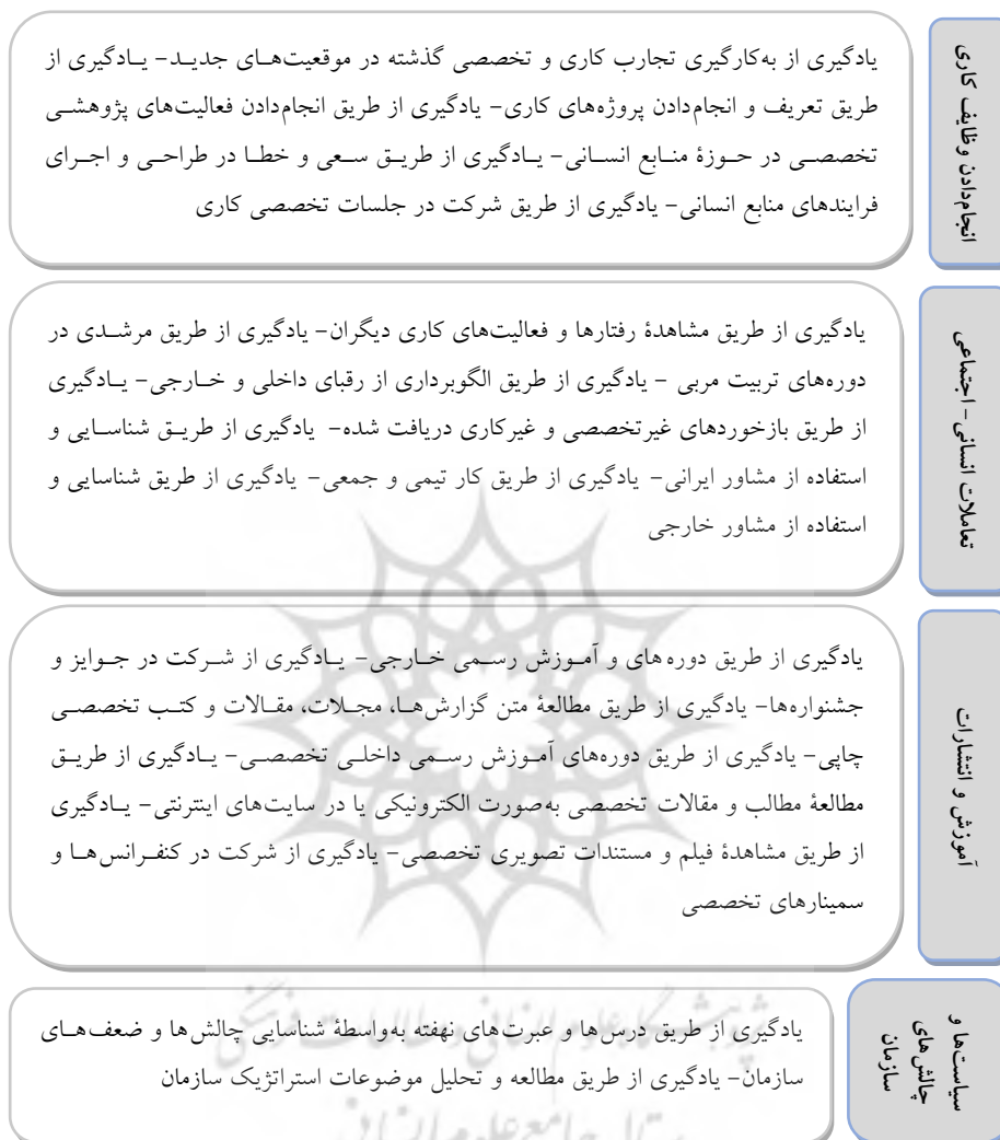
شکل ۲. همه مقوله‌های شناسایی شده در گام سوم تحلیل