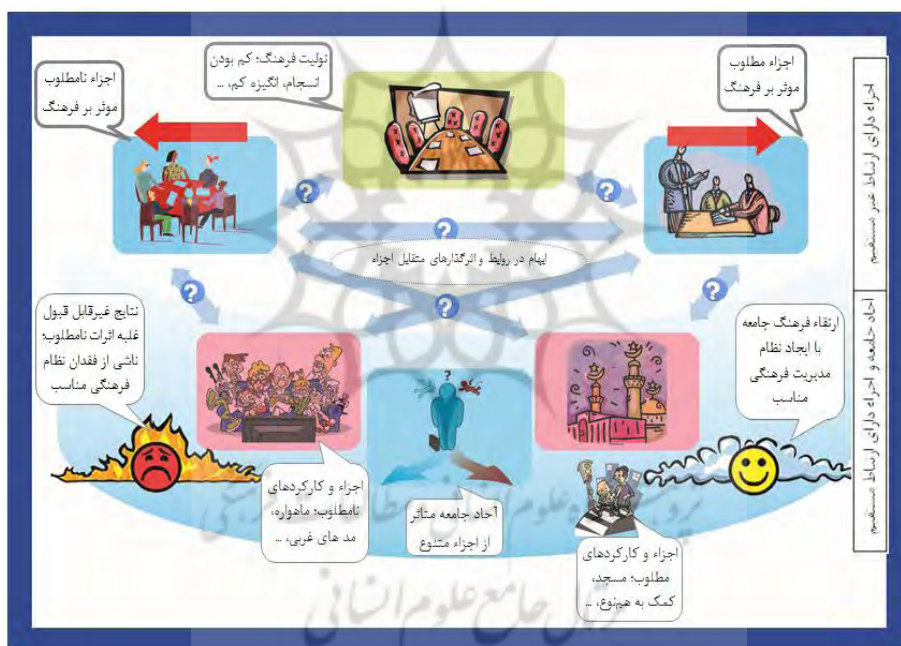
شکل ۲. تصویر غنی (Rich Picture) از مسئله نظام مدیریت فرهنگ اسلامی

تکنیک تصویر غنی، یکی از موفق‌ترین و پرکاربردترین روش‌هایی است که در روش‌شناسی سیستم‌های نرم- و البته در برخی دیگر از روش‌شناسی‌ها نیز- مورد استفاده قرار گرفته است (Jackson, 2003) تصویر غنی معمولاً در قالبی غیررسمی، عامیانه و کاریکاتوری، وضعیت موجود مسئله و عناصر اساسی آن را نمایش می‌دهد. در ترسیم تصویر غنی از وضعیت موجود نظام مدیریت فرهنگی جامعه، سعی شده است عناصر اصلی مسئله شامل مفاهیم، اجزاء، مشکلات و رابطه بین ساختار و فرآیندها (مفهوم climate (Pid, 2003)) به‌طور شماتیک لحاظ شوند. در شکل ۲ تصویر غنی ترسیم شده، نمایش داده شده است.