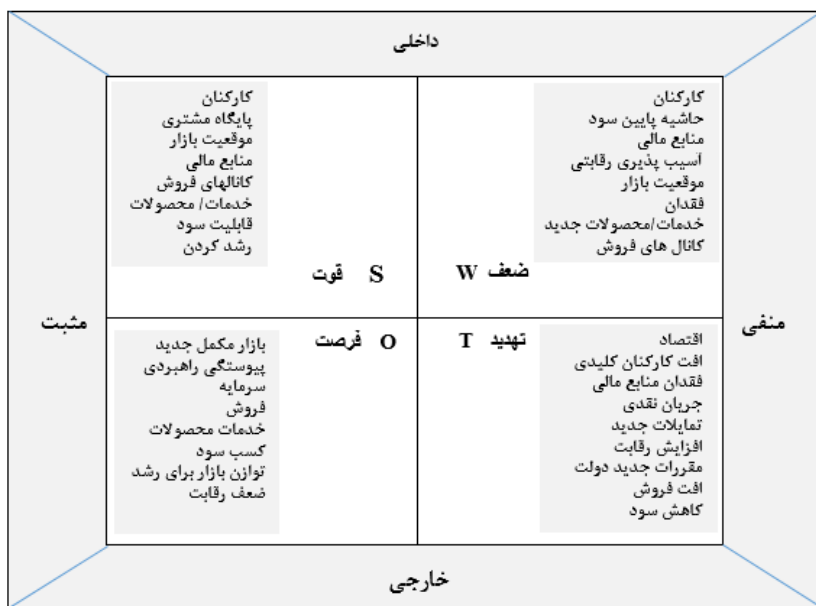
شکل ۱. ترکیب SWOT (بی و یانگ، ۲۰۱۳)

خوب دارد (Ramoshjan et al, 2014, 75). تکنیک SWOT (قوت، ضعف، فرصت‌ها و تهدیدها)، چهار جنبه از یک مورد را بررسی و سپس ارزیابی و در نهایت نتیجه گیری می‌نماید (شکل ۱).