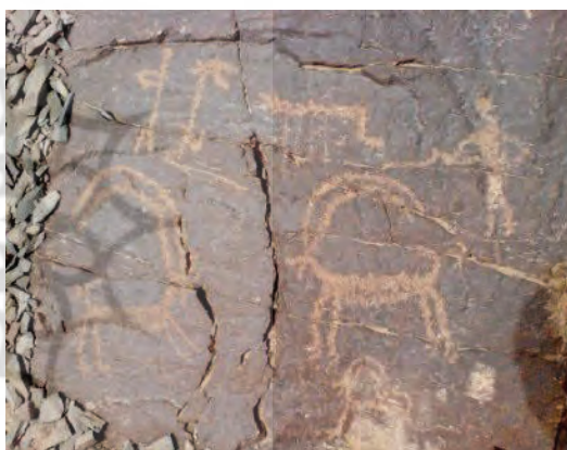
تصویر ۵- سنگ‌نگاره بز کوهی همراه با صحنه شکار یافت شده در گلپایگان، لادراز، مأخذ: (جمالی، ۱۳۹۴، تصویر شماره ۱۰۰ صفحه ۲۶۹).

ق.م) و پارینه سنگی پایانی ۵ (تا حدود ۱۲۰۰۰ ق.م) تقسیم شده است. پارینه‌سنگی دوره‌ای طولانی از زندگی بشر است که فرآیندهای تکاملی انسان شامل: دوره آغازین: یافتن غذا و ذخیره‌سازی محدود آن، ساخت افزارهای سنگی بزرگ و بدون ظرافت، شناخت آتش، دوره میانی: استفاده از ابزارهای سنگی باظرافت بیشتر و اندازه کوچک‌تر (نظیر سرنیزه، چاقوی دسته‌دار، هاون و آسیاب‌های سنگی، دسته‌هاون، ساطور، تبر، مته)، آیین تدفین انسان نئاندرتال همراه با ابزار و نیز غالباً شاخ بزکوهی، دوره پایانی: حضور انسان هوشمند آناتومی نزدیک به انسان امروزی که نشانه‌هایی از تمدن را نیز با خود داشت، ساخت ابزار ریز قطعه‌سنگی و استخوانی باظرافت بالا، نخستین نشانه‌های هنری شامل کنده‌کاری