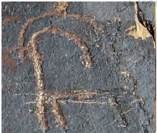
تصویر ۳- سنگ‌نگاره بز کوهی یافت شده در سرکوبه خمین متعلق به دوران نوسنگی.

از بدو خلقت همواره هنرمند با خلق اثر تلاش کرده است یک ارتباط بصری با دنیای اطراف و بیننده برقرار نموده و پیغامی را به مخاطب ارسال نماید. در طول زمان نوع و کیفیت این ارتباط بصری تغییر نموده و ارزش‌های فرهنگی، اعتقادی را نیز در بر گرفته است، بصورتیکه هنر تجلی بارز فرهنگ هر قوم و ملتی شده است. تولستوی بیان می‌دارد که هنر عالی‌ترین تجلیات تصور خدا، زیبایی و لذت روحی و معنوی است.