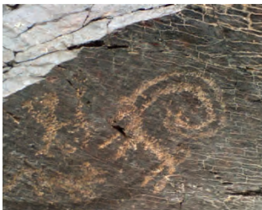
تصویر ۴- سنگ‌نگاره بز کوهی یافت شده در گلپایگان، مأخذ: (جمالی، ۱۳۹۴، تصویر شماره ۵۶ صفحه ۲۵۶).

دوران نوسنگی ۷ (۷۵۰۰-۵۰۰۰ ق.م) دارای دستاوردهای شامل گسترش کشاورزی (تولید گندم و جو) و اهلی کردن حیواناتی شامل بز، میش، گوسفند و اسب، اختراع چرخ و قایق، تکنیک کار با سفال، آشنایی با بافت البسه و ریسندگی، ایجاد واحدهای اجتماعی نظیر روستاها با نظام‌های مشارکتی ساده، نهادینه شدن برخی باورهای آیینی و اعتقادی، بوده است. شکل‌گیری حرفه‌هایی نظیر، دام‌پروری، کشاورزی، ریسندگی، شکار و سفالگری را می‌توان در این دوران دید. فرایند مهاجرت نیز در