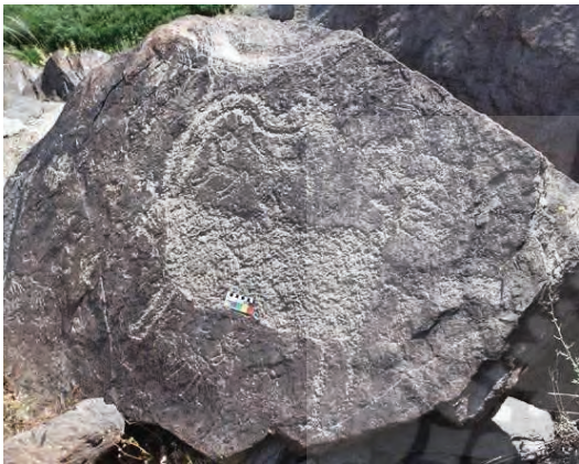
تصویر ۲- نقش بز کوهی با شاخ‌های موج‌دار بر سنگ‌نگاره بازمانده از ۷۰۰۰ سال پیش از میلاد (نوسنگی)، یافت شده در تیمره خمین (۱۱۴×۱۲۳ سانتی‌متر)، موج‌دار بودن شاخ بیان‌کننده نماد آب و جریان است.