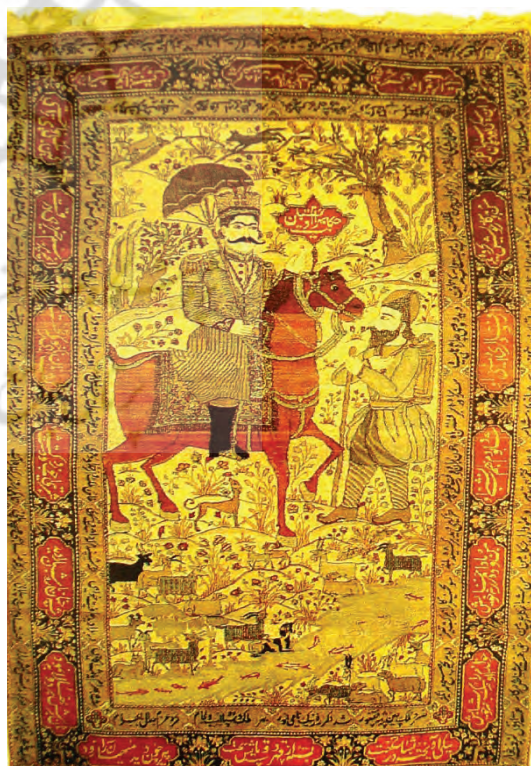
تصویر ۲- بهرام و شبان - (Milanesi, 1999:97) محل و تاریخ بافت: کاشان، سده ۱۹ میلادی محل نگهداری: مجموعه خصوصی

نمونه دوم فرش حکایت بهرام گور و شبان: شرح داستان: (تصویر ۲) این نمونه هم اشاره به داستان بهرام گور و شبان دارد. بهرام گور بعد از آگاهی یافتن از خیانت وزیر سر به کوه و صحرا گذاشته است تا به چاره‌اندیشی بپردازد. در این میان با شبانی مواجه می‌شود که سگی را به درخت بسته است؛ بهرام جوپای این کار وی می‌شود و پی می‌برد که شبان به علت خیانت سگ به گله، او را مجازات کرده است. شرح تصویر: این صحنه همانند مورد قبل لحظه پند گیری بهرام از شبان و سگ به دار آویخته را نشان می‌دهد. در متن فرش همه عناصر اعم از پیکره‌های انسانی و حیوانی و گیاهان از لحاظ رنگی تنالیده‌ای از رنگ زمینه هستند و در کل متن فرش به صورت متعادل پخش شده‌اند. تنها عنصری که از لحاظ رنگی در زمینه فرش جلب توجه می‌کند رنگ قرمز اسب بهرام گور است و کتیبه‌ای به همین رنگ در بالای سر اسب که اشاره به حکایت بهرام گور و شبان می‌کند. از همین رنگ در رنگ قاب‌های حاشیه پهن نیز استفاده شده است.