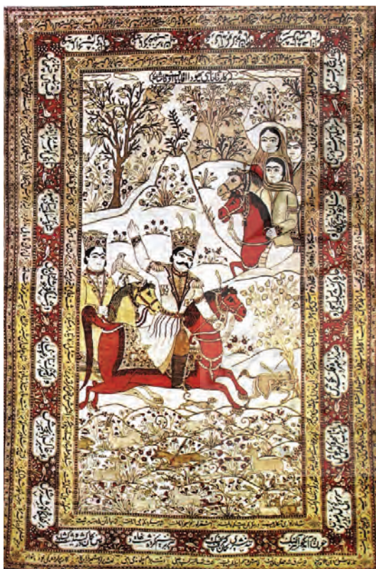
تصویر ۶- شکارگاه بهرام گور، (یساولی، ۱۳۷۴: بخش تصاویر) محل و تاریخ بافت: کاشان، قرن ۱۹ میلادی محل نگهداری: مجموعه خصوصی

نسبت به رنگ زمینه از کنتراست پایینی برخوردار است. بهرام دارای تاجی است که شباهت بسیاری با تاج کیانی دوره قاجار دارد. در پشت سر وی شخص دیگری