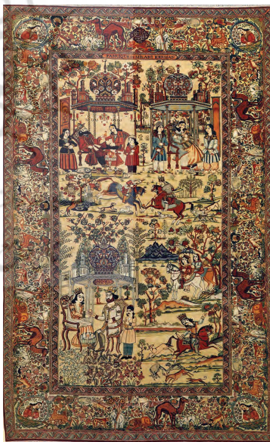
تصویر ۳- بهرام گور در هفت گنبد، (بهارستان، ۱۳۸۴: ۱۷۷) محل و تاریخ بافت: کرمان. ۱۲۹۵ هـ ش محل نگهداری: مجموعه خصوصی

شرح داستان: (تصویر ۳) این داستان مربوط به ازدواج بهرام با دختران هفت اقلیم و ساختن هفت گنبد است، می‌دانیم که بهرام گور از هفت دختر، از هفت کشور، در هفت گنبد هفت‌رنگ، در هفت روز هفته داستان‌ها می‌شنید. لباس