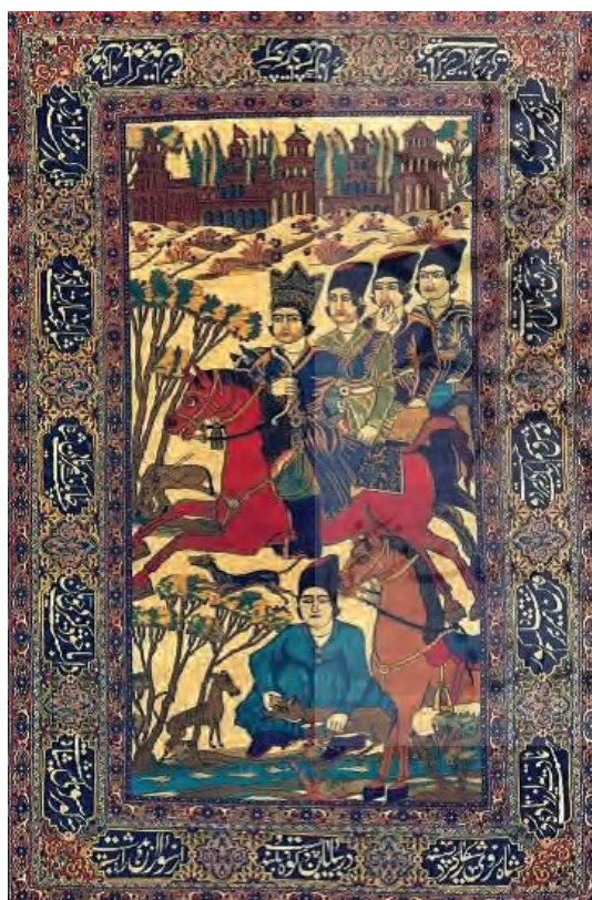
تصویر ۷- ذبح شکار، (موزه فرش ایران، نگارنده) محل و تاریخ بافت: کاشان، قرن ۱۹ میلادی محل نگهداری: موزه فرش ایران

سوار بر اسب و تاجی بر سر که احتمالاً اشاره به ولیعهد محمدعلی شاه (احمدشاه) دارد. چهره اشخاص، آرایش و لباس‌ها قاجاری است. انتخاب رنگ روناسی درزمینه حاشیه پهن و رنگ اسب‌های بهرام گور و کنیزک اهمیت تعادل رنگی در کل تصویر را نشان می‌دهد.