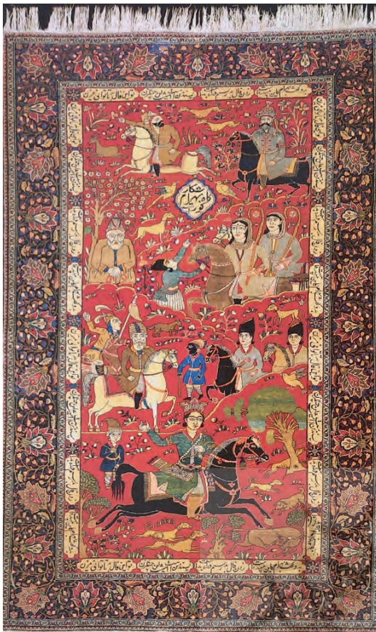
تصویر ۴- بهرام گور و گوهرفروش، (sakhai، ۲۰۰۸: ۱۰۴) محل بافت و تاریخ: کاشان. قرن ۱۹ میلادی محل نگهداری: مجموعه خصوصی

شرح داستان: (تصویر ۴) این داستان مربوط به ملاقات بهرام با گوهرفروش و دخترش است. بهرام در بیشه‌ای به شکار شیر مشغول بود. در این میان به بیشه‌ای رسید که گوسفندان بسیاری مشغول چرا بودند. شاه از شبان علت حضور در این بیشه را که مناسب چرا نمی‌دانست پرسید. شبان به وی پاسخ داد که وی تنها شبان این گوسفندان است و گله از آن گوهرفروش است که خروارها زر و سیم و مال دارد و تنها دختری زیباروی دارد که جز از دست او جام باده نگیرد و از عدالت بهرام شاه است که او بدین ثروت و مال رسیده است. بهرام چون این شنید از لشکریان جدا شده و راه خانه گوهرفروش را در پیش گرفت. روزبه موبد به لشکریان گفت اکنون شاه به در خانه گوهرفروش رفته و مهمان او خواهد شد و از دختر او خواستگاری خواهد کرد. شاه در حرم‌سرا اینک بیش از صد زن دارد. این برای پادشاه کشور شایسته نیست او را به تباهی خواهد کشاند. بهرام به سوی خانه گوهرفروش رهسپار شده و خود را گشسب‌سوار معرفی می‌کند و با گوهرفروش به باده‌گساری می‌پردازد و هنگام مستی دختر وی را که در چنگ‌نوازی و زیبایی سرآمد است خواستگاری می‌کند. گوهرفروش به بهرام می‌گوید که نیک در دختر و روی و موی و کردار و رفتار او دقت کن و نیز در مستی پیوند با کسی مبند. بهرام می‌گوید «این دختر پسند من است، فال بد در این کار مز» (دبیر سیاقی، ۱۳۸۴: ۳۱۳-۳۱۱).