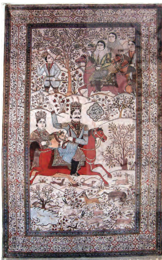
تصویر ۵- شکارگاه بهرام گور، (دادگر، ۱۳۸۰: ۴۷) محل و تاریخ بافت: کاشان، قرن ۱۹ میلادی محل نگهداری: موزه فرش ایران

است؛ چنانچه، بافت این فرش نیز مربوط به دوران حکومت احمدشاه است. کنیزک به‌عنوان دومین عنصر اصلی و بارز تصویر، سوار بر اسبی به رنگ پیازی بوده