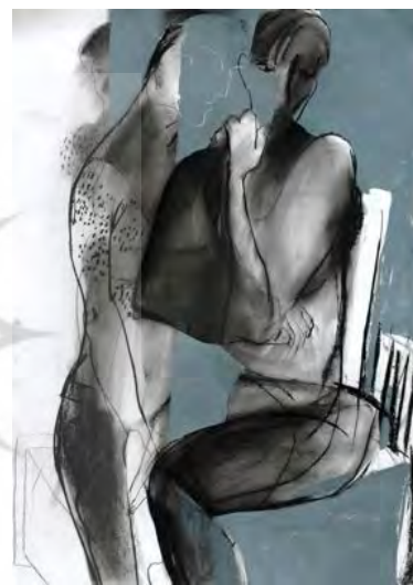
تصویر ۱. تصاویر نگاه بیننده به پیکره زن و نگاه بازگردانده شده توسط زن بازنمایی شده (مآخذ تازنمای انجمن هنرمندان نقاش ایران). هنرمند: ۱-الف- محدثه موحد، ۱-ب- سمیرا کرمی، ۱-پ- معصومه مظفری.

با توجه به نتایج به دست آمده می‌توان گفت: قدرتی که در آثار با بهره‌گیری از "نگاه" بازنمایی شده است، از نوع