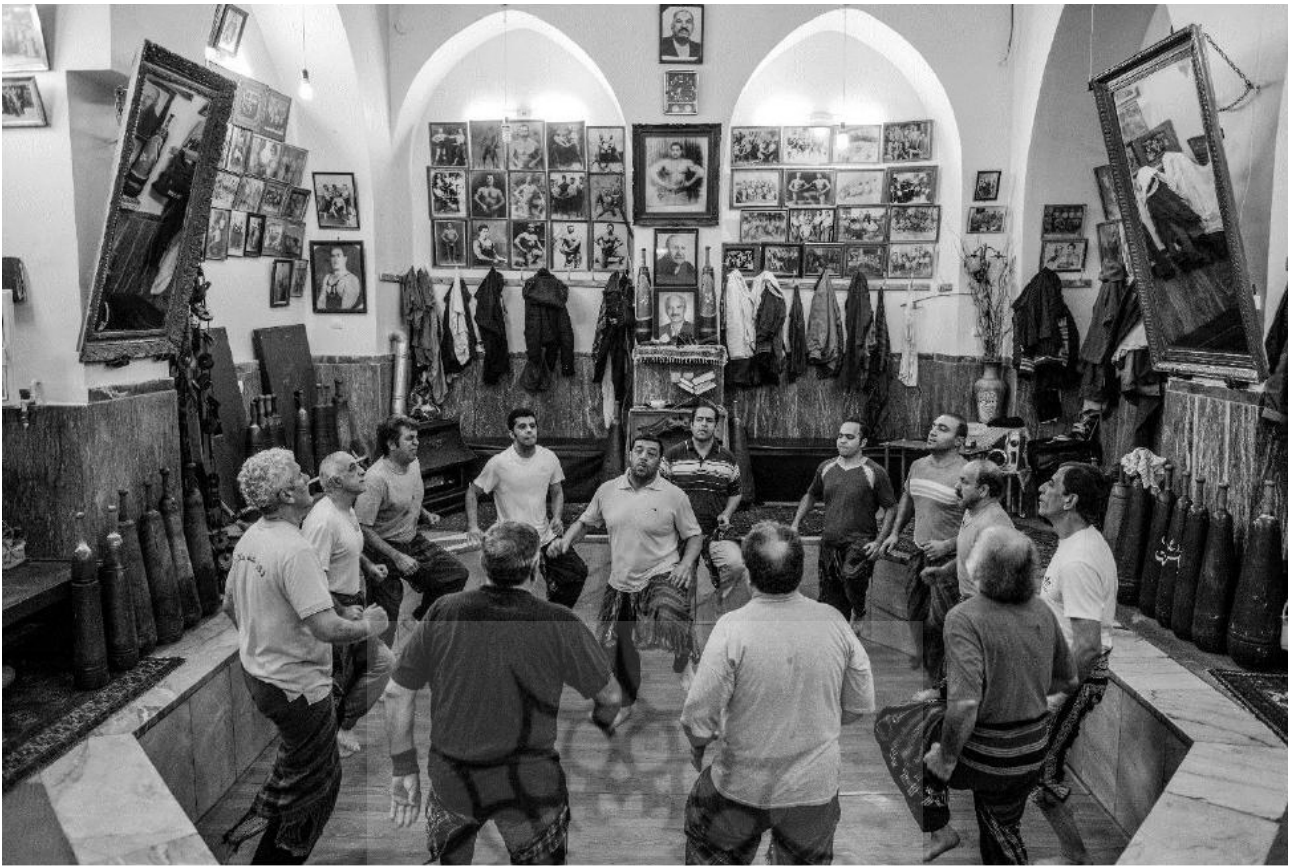
تصویر ۱. استفاده افراطی از قاب‌ها و نمادها و تصاویر محترم و مقدس حکایت از وجهی دیگر از این ورزش دارد که به ابعاد ذهنی و آموزش‌های اخلاقی ورزشکاران می‌پردازد.