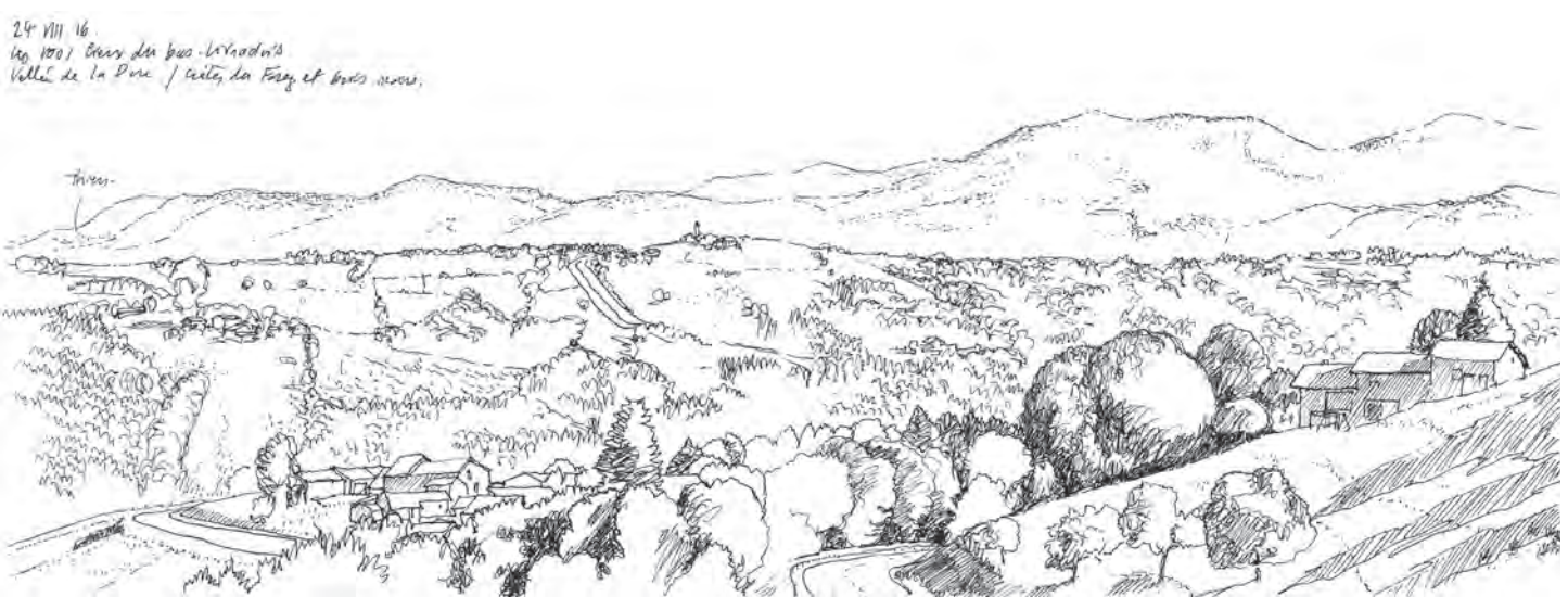
تصویر ۴: بزرگراه د-۹۰۶ از میان تپه‌های لور لیوادوا و دره «دُر» (Dore Valley). ترسیم: الکسیس پرنه، ۲۰۱۶.