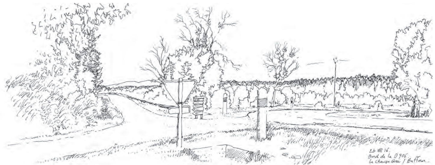
تصویر ۸ : سلسله‌مراتب جاده‌ها: یک تقاطع کوچک در نزدیکی «لاشیز-دیو» (La Chaise-Dieu). ترسیم : الکسیس پرنه، ۲۰۱۶.