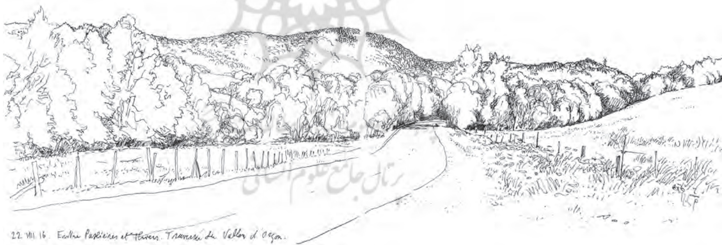
22. VIII 16. Entre Paslières et Thiers. Traversée de Vallon d'Osca.