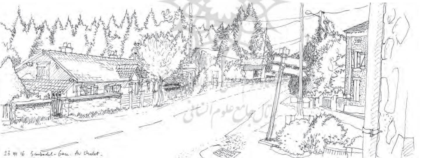
تصویر ۹ : راه میان دهکده : ایستگاه «سامبدل» (Sembadel). ترسیم : الکسیس پرنه، ۲۰۱۶.