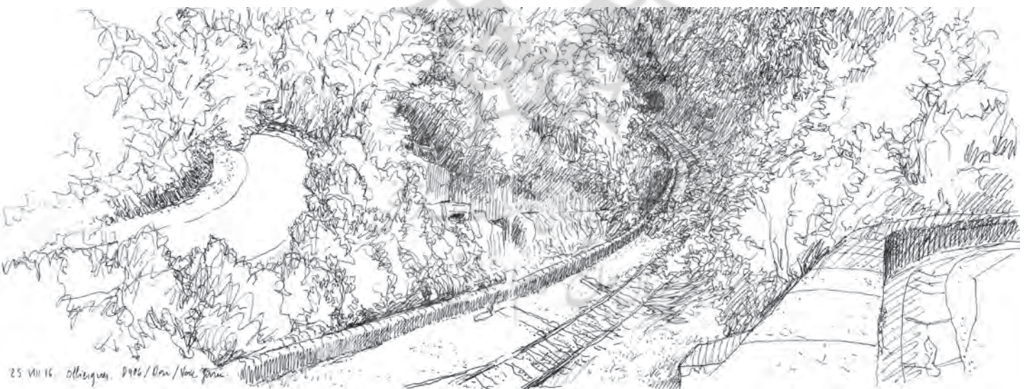
تصویر ۵: مجاورت جاده، رودخانه و قطار در دره دُر. ترسیم: الکسیس پرنه، ۲۰۱۶.

و منظرها کمک کنند. همچنین می‌توانند کمک کنند به تعریف اینکه «منظر راه» کجا باید برای ممانعت از تجزیه منظر بومی و فرهنگی در یک «منظر میانی»، که می‌تواند در هر جایی اتفاق بیفتد، متوقف شود. طرح‌هایی که در ادامه می‌آیند، در طول جاده اصلی میان