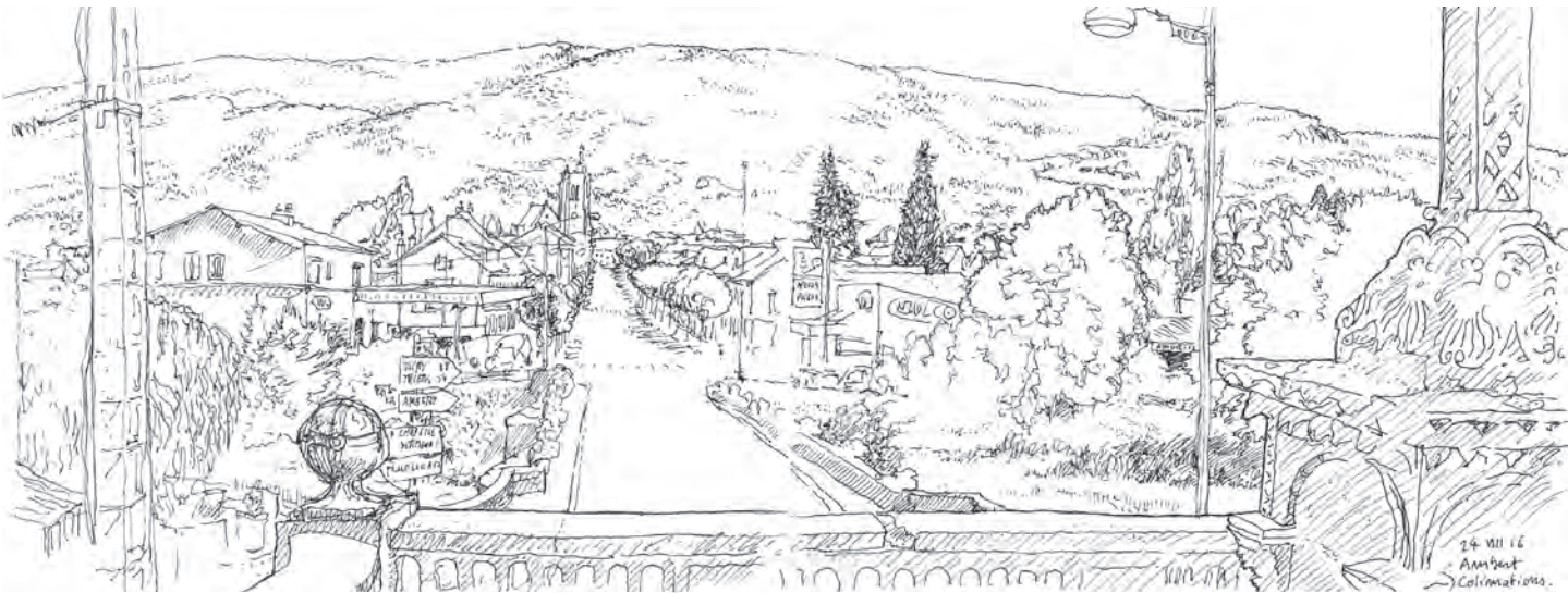
تصویر ۶: ورودی اصلی شهر «آمبر» (Ambert). ترسیم: الکسیس پرنه، ۲۰۱۶.