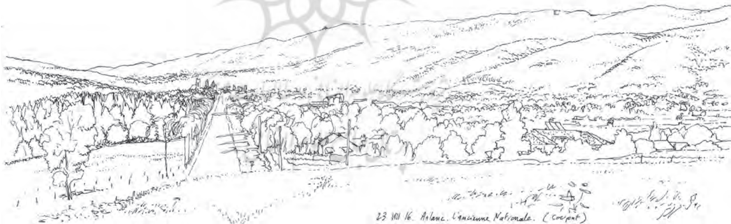
تصویر ۷: جاده در دشت «ارلان» (Arlanc)، خط مستقیم در منظر. ترسیم: الکسیس پرنه، ۲۰۱۶.

و می‌توانند طرحی اولیه برای یک پروژه ساماندهی و طراحی منظر در مقیاس بزرگ باشند. ترسیم‌ها از شمال به جنوب مربوط به پارک طبیعی منطقه‌ای لیواردویس فورز، در طول جاده د-۹۰۶ است و از ۲۲ تا ۲۵ آگوست ۲۰۱۶ توسط الکسیس پرنه انجام شده است.