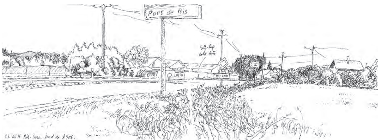
22 VIII 16. Ris-Gare. Bord de D 906.