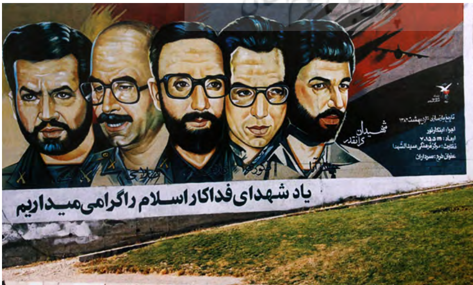
تصویر ۱: تعدادی عکس پرسنلی با ترکیب‌بندی غیرقابل قبول (به علت عدم رعایت اندازه چهره‌ها نسبت به یکدیگر و ترکیب‌بندی نامناسب). مأخذ: غضبانیور، ۱۳۸۹.

نقاشی‌های واقع‌گرایانه از شهدا در بعد از جنگ ایران و عراق به‌عنوان جنبشی که ارزش‌های فرهنگی، اجتماعی و هنری را در پرتو شهدا بازنمایی می‌کنند در این بخش از مقاله مورد بررسی قرار می‌گیرند. عکس‌های پرسنلی شهید مضمون مشترک بسیاری از این آثار است. گرایش جامعه به بازنمایی واقع‌گرای تصاویر شهدا و نمایش تمثال ایشان در منظر شهری، احساس نیاز به هم‌گرایی جامعه پس از جنگ را نمایش می‌دهد. در آن دوران جامعه به یادآوری ارزش‌های ملی-مذهبی و بازنمایی آن‌ها نیاز داشت. بسیاری از جوانان در زندگی روزمره دغدغه دوران جنگ و ارزش‌های آن را ندارند و شهدا موجوداتی فراقلمی محسوب می‌شوند که در اجتماع جایگاهی نداشته و یا حداقل مشکلات زندگی فردی