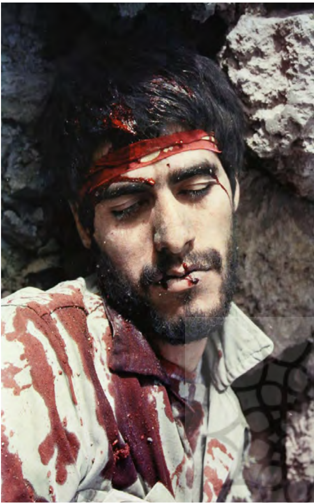
تصویر ۴: شهادت و رستگاری. عکس: احسان رجبی. مأخذ: رجبی و اشتری، ۱۳۹۴.

باورهای سنتی انقلاب (هم چون خودکفایی) را به زیر سؤال برد. اینترنت و رسانه‌های مجازی نیز کنترل فضای فکری شهروندان را سخت‌تر نمود. همه این‌ها تعدادی از عوامل در تغییر اجتماعی در ایران محسوب می‌شوند. تا آنجا که دولتمردان ایران از تهاجم فرهنگی و بحران جوانان سخن گفتند و نقاشی دیواری یکی از ده‌ها راه برای مقابله با این تهاجم است، بیشتر مورد توجه قرار گرفت و به دلایل فوق نقاشی‌های دیواری هر چه بیشتر در شهرها حضور یافتند. البته این نقاشی‌ها فقط مورد حمایت دولت نبودند بلکه عامه مردم از این نقاشی‌ها استقبال می‌کردند و این مسئله به‌عنوان عامل حمایت‌کننده و پایگاه مردمی این سبک بایستی مورد توجه قرار گیرد (کفشچیان مقدم، ۱۳۸۵: ۲۵). بسیاری از نقاش‌هایی که به این شیوه نقاشی می‌کردند، کسانی بودند که هنرمند آکادمیک محسوب نمی‌شوند و حتی بعضی از آن‌ها پرده‌های تبلیغات سردر سینماها را نقاشی می‌کردند. در