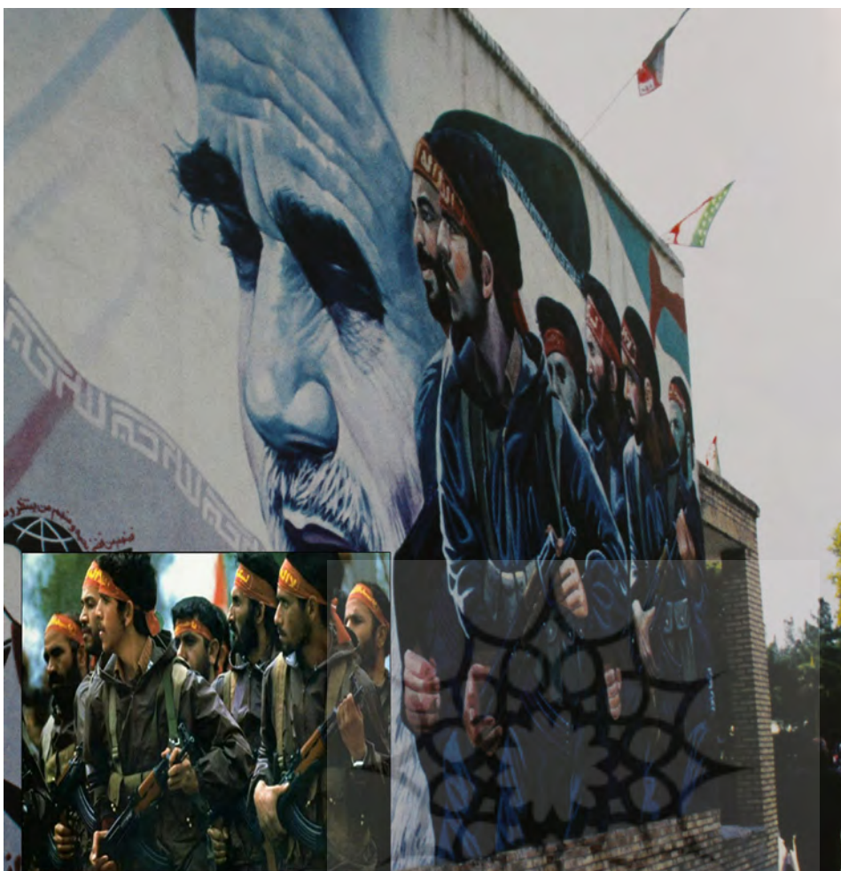
تصویر ۵: لباس سبز سربازان، شرنگ قرمز سربندها و نوشته‌های زرد رنگ بر روی سربندها.

روزمره به وجود آید. نقاشی‌های دیواری واقع‌گرای شهیدا در شهر گفتمان «شهید زنده» را به نمایش درآورد. مجالی که جامعه ایرانی و حتی گردشگران خارجی بودن در کنار شهید را تجربه کنند: تجربه از گفتمان تاریخ رشادت و شهادت در زمان و مکانی متفاوت. در حقیقت این نقاشی‌های واقع‌گرا حافظه جمعی جامعه را تحت تأثیر قرار می‌دهد. گفتمان نقاشی‌های دیواری واقع‌گرا به کمک ساختار ساده خود با گروه عظیمی مخاطب ارتباطی صمیمی برقرار می‌نماید. گفتمان نقاشی‌های دیواری شهیدا تلاش دارد مخاطب را به اندیشیدن وا دارد (Sreberny, 2013: 219).