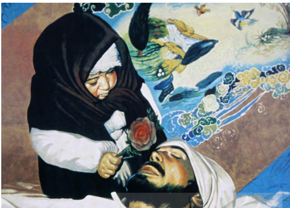
تصویر ۳: تصویر شهید و فرزند که در بزرگراه مدرس اجرا شده بود.

فیزیکی (از بین رفتن امکانات) و چه غیر از آن مانند تغییرات گسترده هرم جمعیتی و نهاد خانواده (اباذری، ۱۳۸۱: ۳۲) تا تغییرات نهادهای بزرگ جامعه مانند دولت. در اسلام، جهاد در راه خدا یک وظیفه شرعی است. در قرآن آمده است که «با کسانی که به خداوند و رستاخیز ایمان ندارند و آنچه که خدا و رسولش حرام کرده، حرام نمی‌دانند، جنگ کنید و نیز با اهل کتاب که به دین حق نمی‌گروند، بجنگید. با آنان تا هنگامیکه به دست خود جزیه دهند و تسلیم شوند بجنگید» (سوره توبه، آیه ۲۹). در آیه دیگری به جهادگران خداوند بشارت می‌دهد: «اموال و جان خویش را فدا کنید... خداوند گناهان شما را خواهد بخشید. خداوند شما را به باغ‌هایی که زیر درختانش نهرها جاری است، وارد خواهد کرد» (سوره توبه، آیات ۸۹-۸۸). جنگ در راه اسلام جهاد نامیده می‌شود. هنر دفاع مقدس وابسته به زمینه اجتماعی خلق این آثار است. هنرمندان با استفاده از نمادها جنگ را به‌عنوان امری مقدس به جامعه معرفی می‌کنند و از جنگ به‌عنوان هدیه‌ای الهی یاد می‌کنند تا در آن انسان‌ها به کمال و قرب الهی برسند. این شیوه بازنمایی از جنگ خود بازتولید گفتمان‌هایی است که تنها با شناخت زمینه‌های اجتماعی آن تفسیرپذیر خواهد بود. در جنگ ایران و عراق، جنگ معنای اسلامی خود یعنی جهاد و دفاع را بازنمایی می‌کنند. در اسلام تمام جنگ‌ها جز جهاد نفی می‌گردند و معنای جهاد یعنی جنگیدن در راه خدا. وظیفه جهادگران رویارویی با کافران و