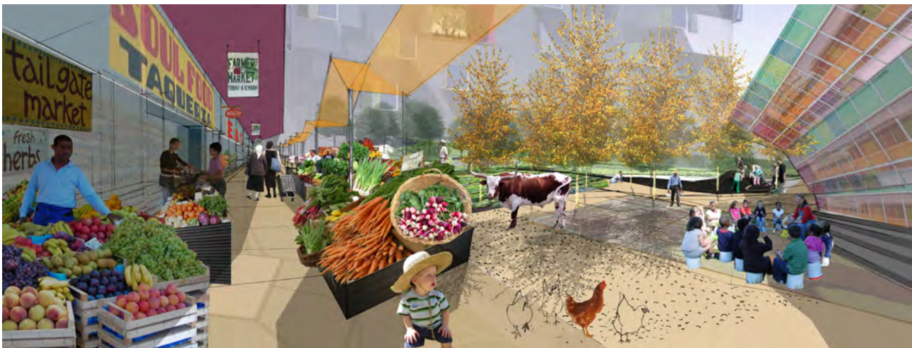
تصویر ۴: پروژه زرو (OFEX) مبتنی بر اشتراک مردم در ایجاد فضای سبز شهر و درعین حال مدیریت و بهره‌برداری از آن است.

عدم شناخت صحیح پتانسیل‌های زیبایی‌شناسی منظر پایدار می‌تواند موجب غفلت از بخش مهمی از فرهنگی منظر و متعاقب آن از دست دادن بخشی از مخاطبان آن گردد. بنابراین، گویی که بتواند به تعریف وجوه زیبایی‌شناسی پایدار و تأثیر آن بر پایداری بپردازد ضروری می‌نماید. در این نوشتار چهار اصل کلی برای تدوین وجوه زیبایی‌شناسی منظر پایدار ارائه شده است که در صورتی که به‌عنوان الگوهای راهبردی به کار گرفته شود، می‌تواند موجب پایدارتر شدن مناظر طراحی شده گردد.