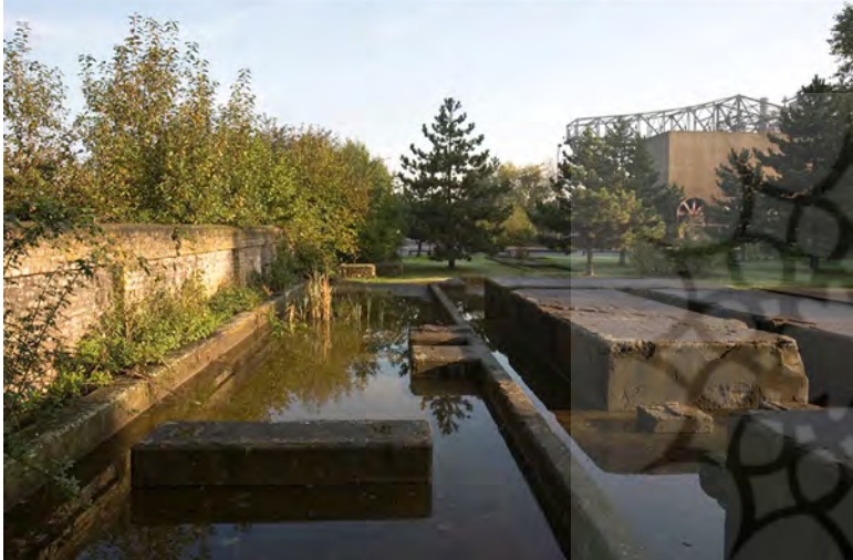
تصویر ۱: کانال انتقال پساب که بر رودخانه امشر قرار داشت به کانالی در جهت چرخه آبی اکوسیستم بدل شد.