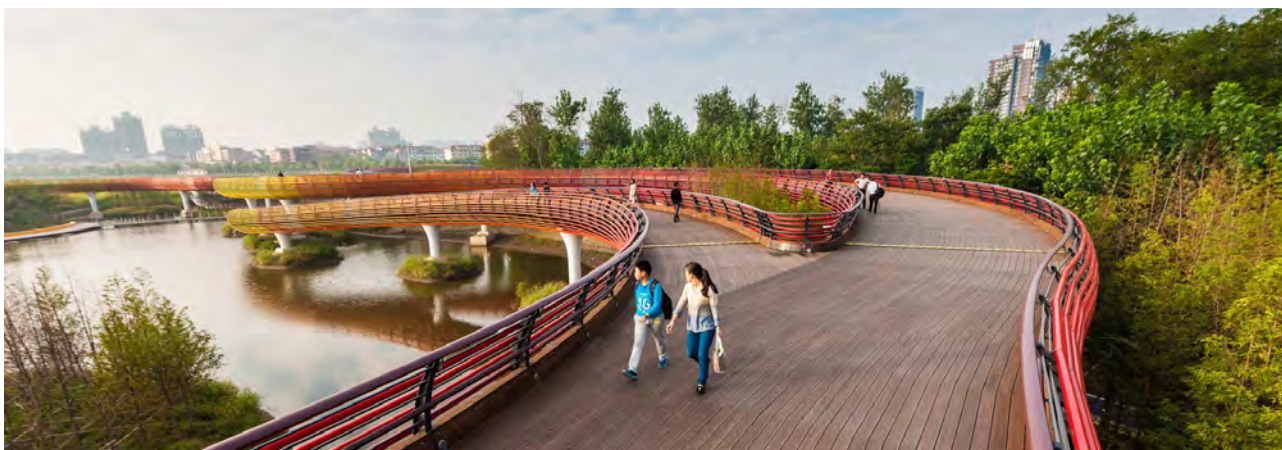
تصویر ۲: پلی که دو سمت رودخانه را به هم متصل نموده است، با الهام از افسانه‌های محلی شکلی شبیه اژدهایان فستیوال‌های سال نو چینی به خود گرفته است که برای مردم آن ناحیه تداعی‌کننده مفاهیم ذهنی خاص است.