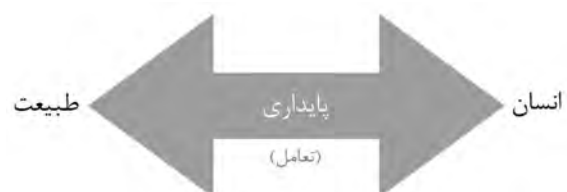
شکل ۱: پایداری نوعی رابطه تعاملی میان انسان و طبیعت است.

مقدمه | توسعه پایدار یک پارادایم مهم در فهم رابطه انسان و طبیعت و انسان‌ها با یکدیگر است. این مسئله با دیدگاه دو قرن گذشته انسان که بر پایه جدایی موضوعات محیطی و اجتماعی و اقتصادی شکل گرفته بود، در تضاد است. در دو قرن گذشته، این تصور حاکم بود که محیط یک عامل خارجی است و به‌عنوان بستری برای استفاده و استثمار انسان در نظر گرفته می‌شد. این نگرش تحت تأثیر پیشرفت شگرف تکنولوژی در قرن اخیر به سيطرة انسان بر طبیعت انجامید و موجب برهم خوردن نظام‌های زیستی در مناطق تحت اثر وی شد. به‌مرور زمان با بروز عواقب دخالت‌های بشر در اکوسیستم‌ها، علم جدیدی تحت عنوان پایداری شکل گرفت که اساس آن بر پایه اصلاح رابطه انسان و محیط است (شکل ۱). با ورود مفاهیم پایداری به حوزه منظر و شهرسازی، واژگان جدیدی چون منظر پایدار و شهر پایدار به وجود آمد که به دنبال ارائه الگوهایی‌اند که موجب استمرار انسان و طبیعت در کنار یکدیگر - و نه در مقابل یکدیگر - شود. با بررسی تجربیات دو دهه گذشته در حوزه منظر و شهرسازی می‌توان دریافت که غالب آنچه به‌عنوان مباحث منظر پایدار ارائه می‌گردد، تأکید بر جنبه اکولوژیک پایداری دارد و در آن جنبه‌های زیبایی‌شناسانه جایی ندارد. این در صورتی است که منظر به‌عنوان پدیده‌ای فرهنگی، همواره تحت تأثیر ادراک زیبایی‌شناسانه مخاطب قرار دارد و نمی‌توان آن را جدا از جنبه‌های اکولوژیک در نظر گرفت. از این رو، به نظر می‌رسد برای دستیابی به منظری پایدار باید علاوه بر اصول اکولوژیک، الگوهایی برای تأمین نیازهای زیبایی‌شناسانه منظر نیز ضروری است.