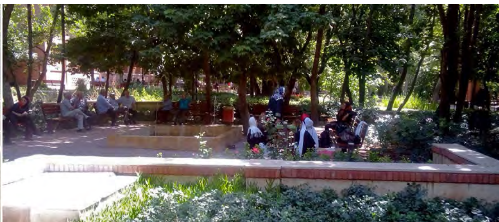
تصویر ۹ : بوستان باغ ایرانی، تهران. عکس : مریم‌السادات منصوری، ۱۳۹۴.