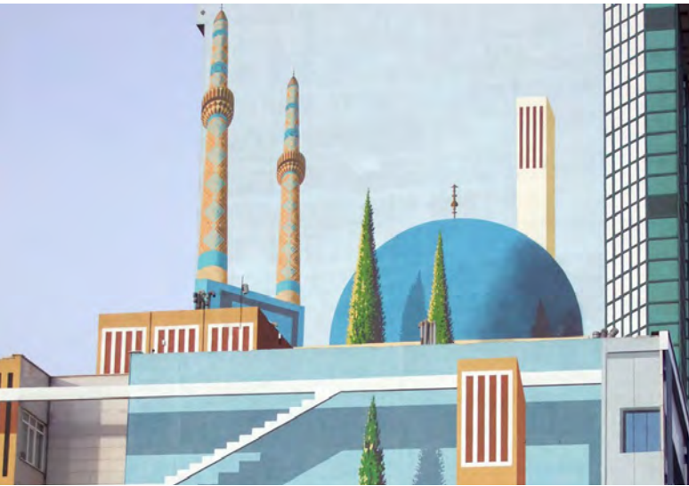
تصویر ۶: دیوارنگاری با مضمون مذهبی، روش اجرا: رنگ روی پوشش سیمانی.