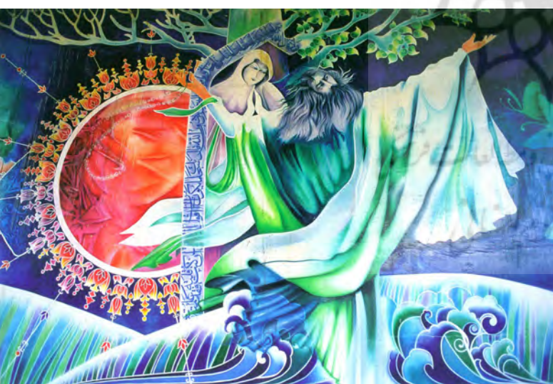
تصویر ۲: دیوارنگاری با مضامین ادبی و معرفتی، روش اجرا: رنگ روی پوشش سیمانی.