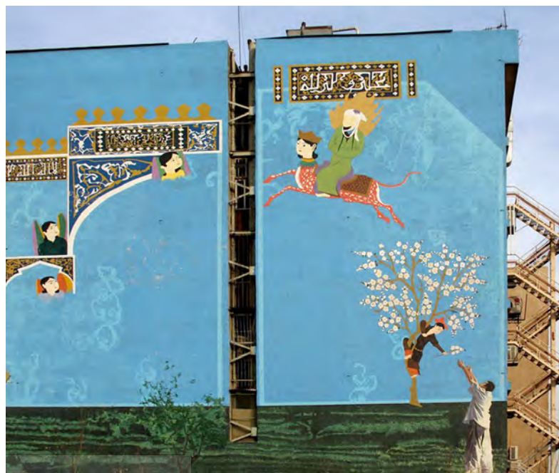
تصویر ۳: دیوارنگاری با مضامین عرفانی و معرفتی، روش اجرا: رنگ روی پوشش سیمانی.