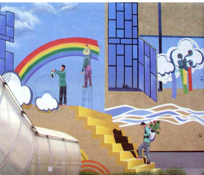
تصویر ۴: دیوارنگاری با مضمون سورئالیستی، روش اجرا: رنگ روی پوشش سیمانی.