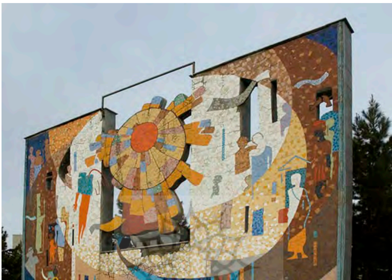
تصویر ۷: دیوارنگاری با مضمون فرهنگی، روش اجرا: موزاییک با قطعات کاشی.

منظر شهری و هویت‌مندی آن بیش از زیباسازی شهری از کارکردهای دیوارنگاری بهره می‌برند و این مسئله نشان از تأثیرات بطئی و عمیق دیوارنگاری در منظر شهری دارد.