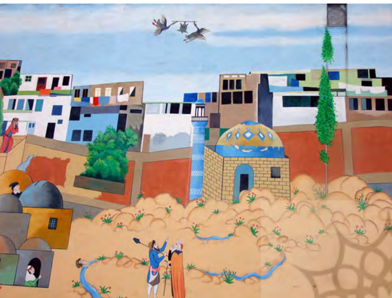
تصویر ۱: دیوارنگاری بر مبنای داستان‌های عامیانه، روش اجرا: رنگ روی پوشش سیمانی.