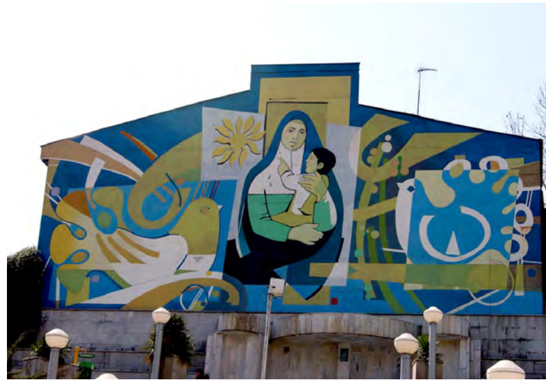
تصویر ۵: دیوارنگاری با موضوع مادر، روش اجرا: رنگ روی ورق‌های فلزی.

برخورد دارند که هم بر رویکرد عینی منظر شهری و هم بر رویکرد ذهنی آن تأثیر می‌گذارند. دیوارنگاری شهری به‌عنوان شیوه‌ای از هنرهای تجسمی می‌تواند رسالت این نوع از هنر را در فضای شهری اجرا کند. ظرفیت‌های این هنر به‌طور بارز از طریق فرآیندهای زیر، در خصوصیات بنیادین منظر شهری شامل «خوانایی»، «هویت‌مندی» و «زیبایی» (نمودار ۱) اثرگذار است: - تولید و ارائه معنای منجر به هویت و جذابیت و اعتباربخشی به هویت موجود