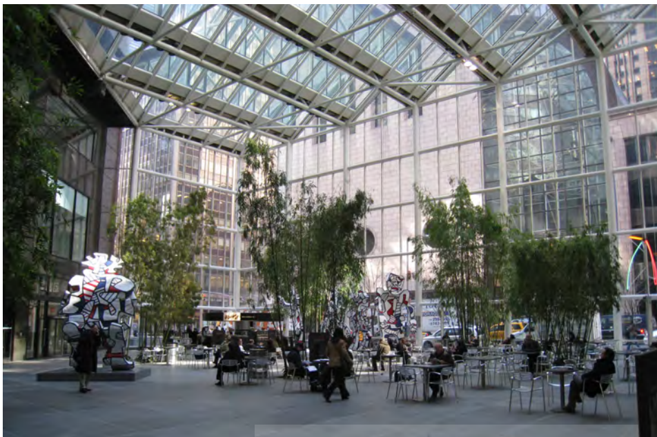
تصویر ۲: آتریوم ساختمان اداری آی بی ام در نیویورک. منظره‌پردازی مرزگونه آتریوم این بنای اداری، فضایی نیمه عمومی را شکل داده که باعث غنای حیات شهر می‌شود.

شهری در شهرهای مختلف دنیا شکل گرفته‌اند. پلازاهای شهری، پیاده راه‌های سرپوشیده، گالری‌های نیمه‌باز بین دو بلوک شهری، آتریوم‌ها و پلازاهای نیمه‌باز از جمله فضاهایی هستند که به‌عنوان فضای نیمه عمومی هویتی مرزگونه بین شهر و کاربری مجاور ایجاد می‌کنند و باعث غنای حیات شهری می‌شوند. به‌عنوان مثال آتریوم برج اداری-تجاری «وال استریت ۶۰» ۱ (تصویر ۱) و آتریوم ساختمان اداری «آی بی ام» ۲ (تصویر ۲)، نمونه‌های موفقی از فضاهای نیمه عمومی هستند که مرز بین فضای اداری و شهر محسوب می‌شوند. محوطه مجموعه اداری «مترو تک» ۳ (تصویر ۳) نیز یک