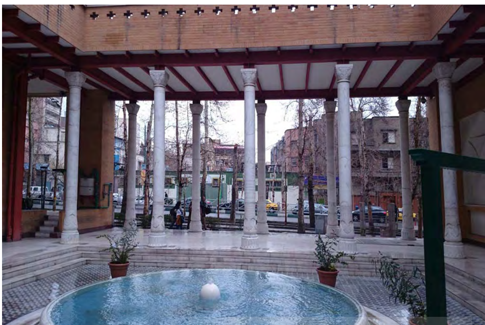
تصویر ۵: رواق هنر در واقع حیاط مجموعه فرهنگستان هنر است؛ فضایی با مالکیت دولتی که به صورت فضایی نیمه عمومی طراحی شده و مورد استفاده شهروندان قرار می‌گیرد.

شهروندسینی و همچنین برای مقابله با دشواری‌های اداره شهرها، در جستجوی راه‌هایی برای تسهیل اداره امور شهرها بوده که یکی از این راه‌ها، استفاده از مشارکت‌های مردمی و بهره‌گیری از مدیریت محله است؛ به گونه‌ای که مردم در قالب گروه‌هایی رسمی مانند شورای محله بتوانند در تصمیم‌گیری و برنامه‌ریزی‌های شهری در مقیاس محلی با سازمان‌های دولتی مشارکت نمایند و بر اتفاقاتی که در فضاهای عمومی و نیمه عمومی محله در جریان است نظارت و تأثیر داشته باشند.