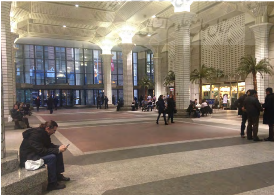
تصویر ۱: آتریوم برج اداری-تجاری وال استریت ۰۶ در نیویورک، نمونه‌ای از منظره‌پردازی فضای نیمه عمومی. مأخذ: http://apops.mas.org/pops/146 .

مسئله‌ای که می‌تواند مدیران و برنامه‌ریزان دولتی را در رابطه با الحاق محوطه ادارات دولتی به فضای عمومی شهر نگران کند بحث ناسازگاری این دو کاربری هم‌جوار است. سروصدای ناشی از اجتماعات مردم و یا حضور آزاد و مدیریت نشده مردم در محل ورودی این ادارات ممکن است باعث ایجاد اختلال در روند فعالیت کاربری اداری