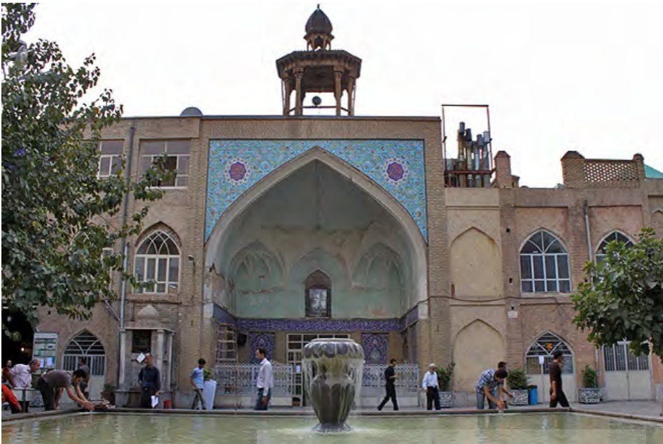
تصویر ۴: حیاط مسجد جامع تهران نمونه‌ای از فضای نیمه عمومی در معماری و شهرسازی ایران.

نمی‌شود بلکه عنصری ذهنی و فرهنگی نیز هست که شکل‌گیری آن در اذهان مردم با دخالت تاریخ، اعتقادات دینی و اسطوره‌ای، اقلیم، سنت زیست و امثال آن‌ها بوده است (منصوری، ۱۳۸۳: ۷۳). بنابراین برنامه‌ریزی و تعیین فضاها، مرزها و عرصه‌های جدید شهری باید متناسب با ساختار ذهنی و فرهنگی مخاطب باشد. برای تعریف نظام فضایی جهت توسعه شهر و بازتعریف مرزها باید نظام فضایی تاریخی شهر مورد مطالعه و بهره‌برداری قرار گیرد تا فضاهای جدید مورد پذیرش عموم مردم واقع شوند. در واقع وجود مرزها و فضاهایی مشابه در سابقه تاریخی و خاطره جمعی شهروندان باعث می‌شود مرزها و فضاهای جدید برای مردم معنی‌دار بوده و مدیریت این فضاها به سهولت انجام پذیرد.