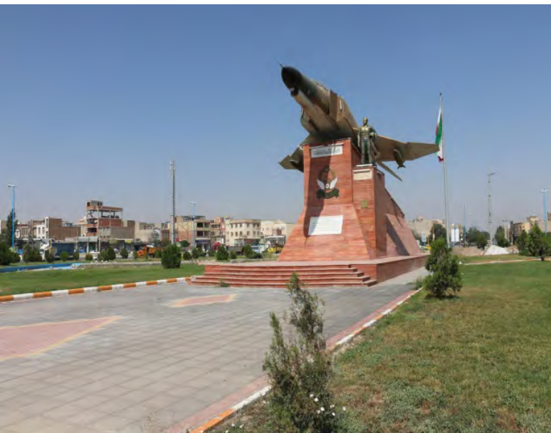
تصویر ۱: یادمان سردار شهید خلبان جدی، اردبیل. عکس: بهزاد مسعودی، ۱۳۹۴.

می‌شود، پاسخ به نیازی است که علاوه بر جنبه‌های کارکردی واجد ارزش‌های نمادین و معنایی نیز هست؛ همچنین در مقیاس‌های خرد شهری به‌عنوان نشانه عمل می‌کند.