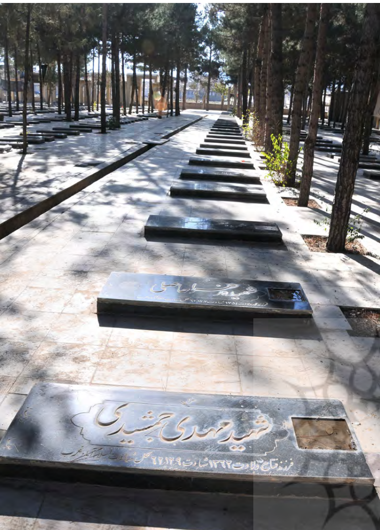
تصویر ۵: گلزار شهدای باغ رضوان اسلام‌آباد، کرمانشاه. عکس: بهزاد مسعودی، ۱۳۹۵.