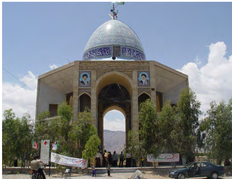
تصویر ۲: گلزار شهدای میرک‌آباد مهریز یزد. عکس: بهزاد مسعودی، ۱۳۹۳.