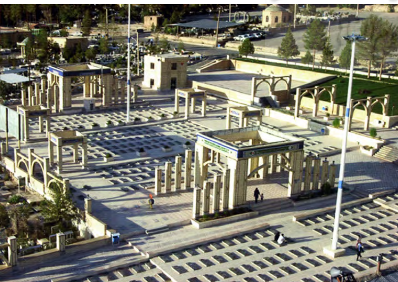
تصویر ۶: گلزار شهدای مرکزی کرمان. عکس: بهزاد مسعودی، ۱۳۹۴.

ایفای نقش می‌کند. ایجاد فضایی دنج برای تأمل فردی در کنار وسعت فضای طبیعی که کارکرد گردشگری را با ابعاد کارکردی زیارتی و یادمانی فضا می‌آمیزد به رونق این فضاها کمک کرده است؛ درحالی‌که حضور مقابر شهدا در این مجموعه ضامن جهت‌گیری فرهنگی و روحیه حاکم بر فضاست (تصویر ۵).