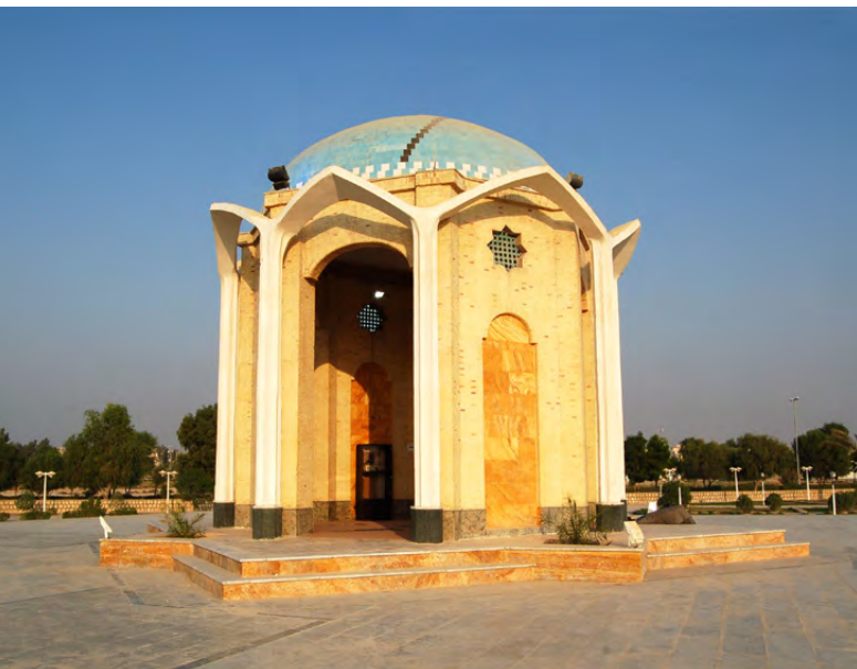
تصویر ۳: گلزار شهدای گمنام بوشهر. عکس: بهزاد مسعودی، ۱۳۹۴.