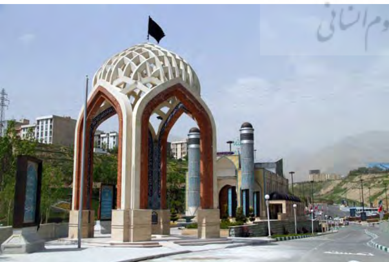
تصویر ۱۲: مزار و یادمان شهدای گمنام بوستان نهج‌البلاغه.

به عبارتی برای تمام اقشار مردم در تمام طول سال قابل دسترسی است.