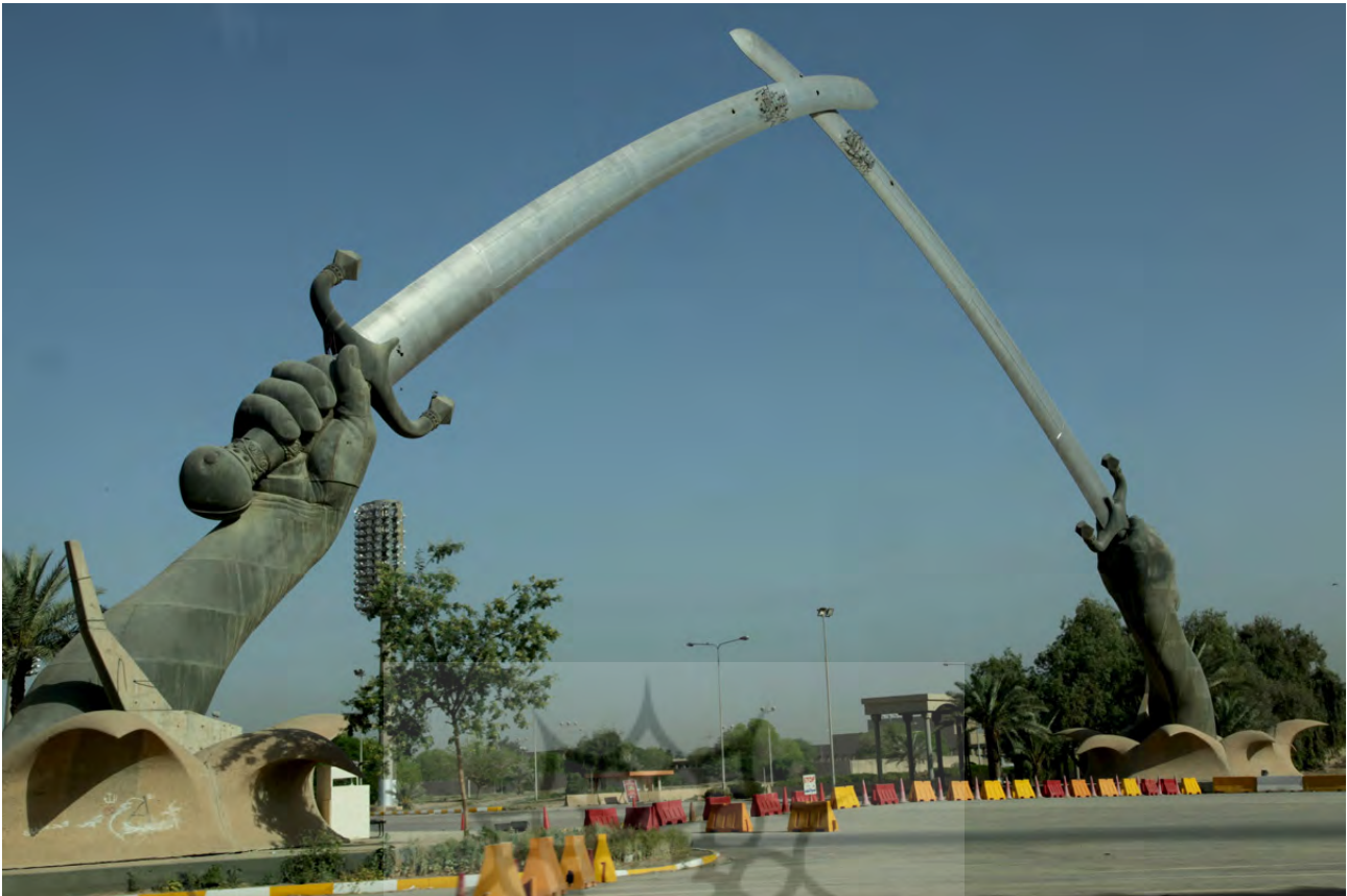
تصویر ۲: یادمان دست‌های پیروز - بغداد.