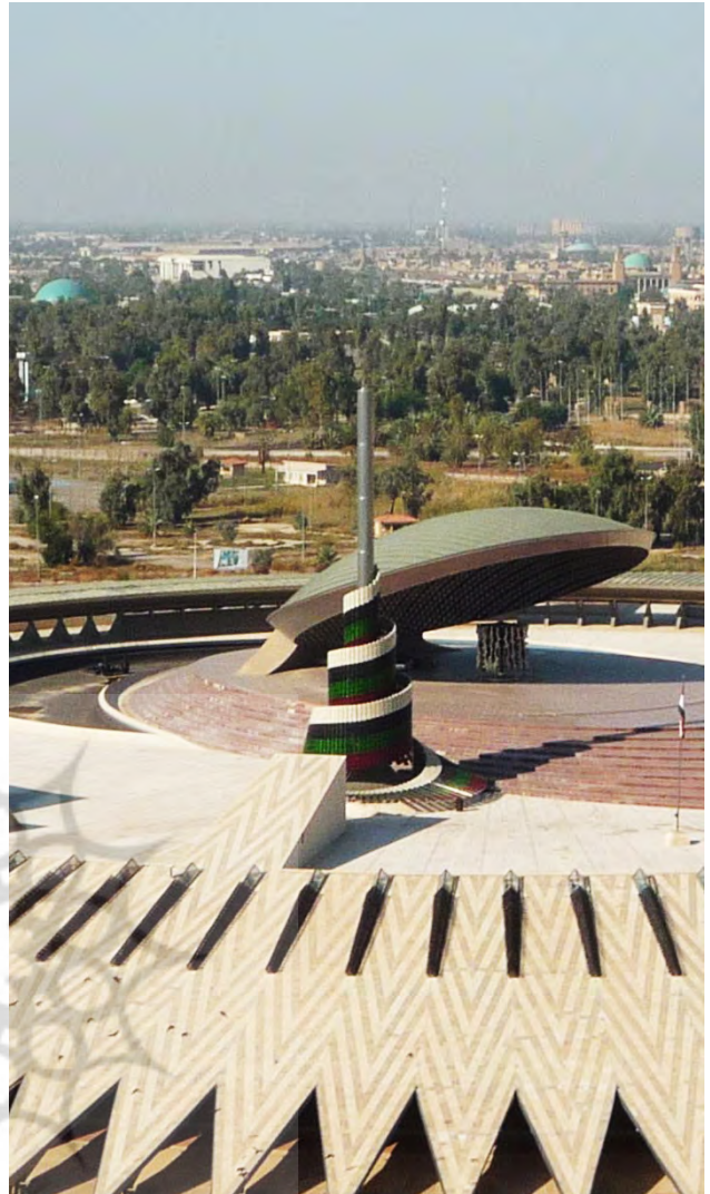
تصویر ۵ : یادمان سرباز گمنام عراقی، بغداد، عراق.

مکان قرارگیری : محله رضافه- بغداد واقع در بافت شهری. این یادمان به سربازان عراقی که در جنگ ایران و عراق کشته شده‌اند، اختصاص داده شده است. این یادمان شامل صغه دایره‌ای شکل به قطر ۱۹۰ متر است. در میانه یک دریاچه مصنوعی، بر روی صغه یک گنبد بیضوی با قطر ۴۰ متر قرار گرفته است که مانند گنبد‌های دوران عباسی بوده و با کاشی‌های فیروزه‌ای پوشیده شده است. این گنبد به دو قسمت تقسیم شده که استعاره‌ای از شهدای تکه‌تکه شده عراقی در جنگ ایران و عراق است (تصویر ۶). در میانه این دو گنبد مجسمه‌ای به صورت پرچم عراق قرار داده شده است (تصویر ۷). به کارگیری موتیف‌های وطن پرستانه شناخته شده برای عوام همچون پرچم، در یادمان‌های شکل گرفته در حکومت‌های دیکتاتوری که در صدد جلب نظر عامه مردم هستند، بسیار مرسوم است. فضای زیرین صغه مصنوعی در دو طبقه شامل کاربری‌هایی همچون موزه، کتابخانه، کافه تریا، اتاق سخنرانی، گالری‌ها و فضاهای پشتیبانی است (www.archnet.org).