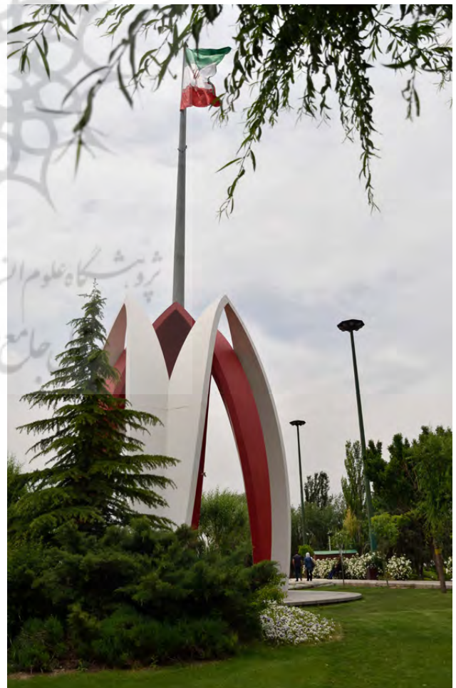
تصویر ۱۳: مزار و یادمان شهدای گمنام بوستان پرواز. عکس: حسین پروین، ۱۳۹۵.

مزار شهدای گمنام کوهف الشهداء ولنجک - مزار شهدای گمنام کوهف الشهداء بالای کوهی در شمالی‌ترین نقطه تهران، در منطقه ولنجک، قرار دارد که در تاریخ ۱۳۸۶/۳/۲۸ تعداد پنج از تن از شهدای گمنام در این مکان به خاک سپرده شده‌اند. مسافت حدود ۵۰۰ متری دامنه را تا مزار شهدا در جاده‌ای خاکی (بدون طرحی از پیش تعیین شده برای محوطه مزار (باید طی کرد تا به غاری با در و دیواری که با سنگ تزئین شده رسید. داخل این غار فضایی به طول هفت و عرض دو متر قرار دارد؛ اتاقی با پنج سنگ مزار در کمال سادگی که