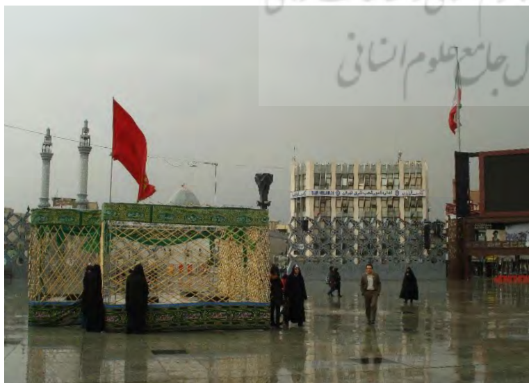
تصویر ۱۰: یادمان شهدای گمنام میدان امام حسین (ع).