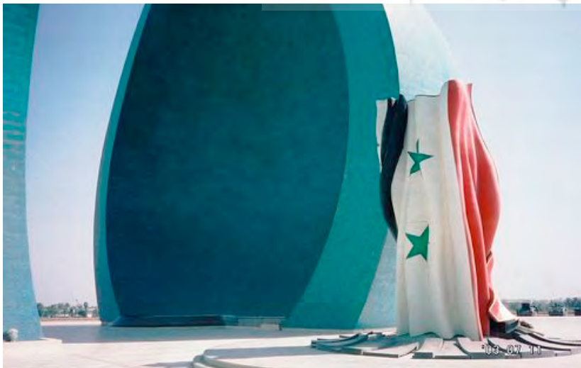
تصویر ۷ : یادمان الشہید، پرچم عراق در زیر گنبد.