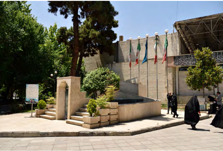
تصویر ۸: مزار شهدای گمنام در کنار ورودی مسجد دانشگاه تهران.

مزار و یادمان شهدای گمنام دانشگاه تهران - انتخاب سایت به‌منظور تدفین شهدای گمنام در دهه اخیر به سمت مراکز دانشگاهی، سوق پیدا کرده است. از این دست می‌توان به ایجاد مزاری ساده بدون طراحی سایت برای پنج شهید گمنام در کنار ورودی مسجد دانشگاه تهران (تصویر ۸) و یادمان شهدای دانشگاه، به صورت فرم خالص به‌دوراز تجمل، در باغ پشت مسجد اشاره کرد (تصویر ۹). در این مورد آخر با طراحی ویژه و فکر شده منظر سایت، به تدریج به یادمان وارد می‌شود، ولی همچنان اولویت با معماری یادمان است. لازم به ذکر است که ارتباط افراد غیر دانشجویان با این مزار و یادمان در مواقع معمولی امکان‌پذیر نیست.