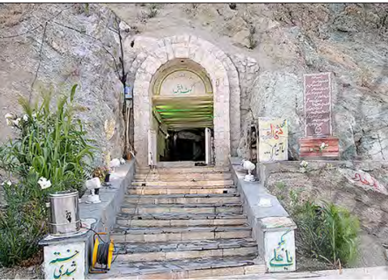
تصویر ۱۱: مزار شهدای گمنام کوهف الشهداء ولنجک.

مزار و یادمان شهدای گمنام بوستان نهج‌البلاغه در روبروی مسجد بوستان نهج‌البلاغه در تاریخ ۱۳۸۹/۷/۱۲ پیکر سه شهید گمنام به خاک سپرده شد. یادمانی به فرم آشنای گنبدخانه بر فراز مزارشان ساخته شده که تأکید بر معماری یادمان بدون استفاده