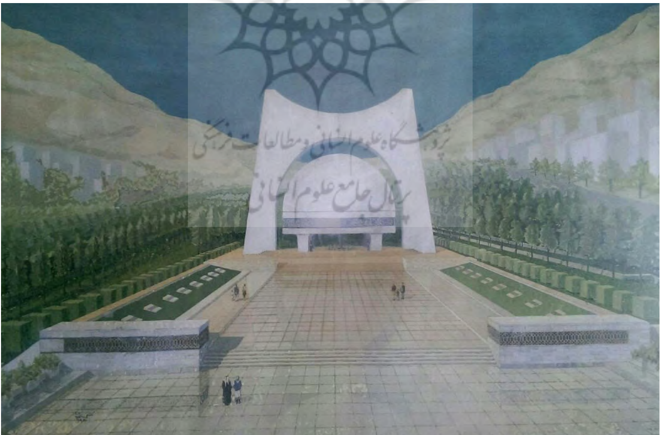
تصویر ۱: یادمان سرباز گمنام سوری - دمشق - سوریه.

فضای جمعی دربردارنده نمادهایی است که عامل تداوم و ارزش‌های جمعی و مدنی مردم و حاوی میراث فرهنگی و تاریخی جامعه است و از این‌روست که فضای شهری به‌واسطه این محتوا مرکز نمادین پایداری ارزش‌های مردمی است که به بیان قدرت خویش می‌پردازند و آن را در فضا متبلور می‌سازند. فضای جمعی مکانی است مناسب برای جاری شدن