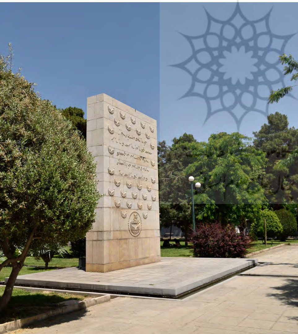
تصویر ۹: یادمان شهدای دانشگاه تهران، در باغ دانشگاه.

مزار و یادمان شهدای گمنام دانشگاه تهران - انتخاب سایت به‌منظور تدفین شهدای گمنام در دهه اخیر به سمت مراکز دانشگاهی، سوق پیدا کرده است. از این دست می‌توان به ایجاد مزاری ساده بدون طراحی سایت برای پنج شهید گمنام در کنار ورودی مسجد دانشگاه تهران (تصویر ۸) و یادمان شهدای دانشگاه، به صورت فرم خالص به‌دوراز تجمل، در باغ پشت مسجد اشاره کرد (تصویر ۹). در این مورد آخر با طراحی ویژه و فکر شده منظر سایت، به تدریج به یادمان وارد می‌شود، ولی همچنان اولویت با معماری یادمان است. لازم به ذکر است که ارتباط افراد غیر دانشجویان با این مزار و یادمان در مواقع معمولی امکان‌پذیر نیست.