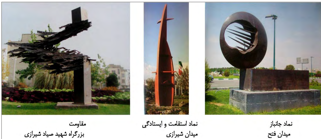
مقاومت بزرگراه شهید صیاد شیرازی