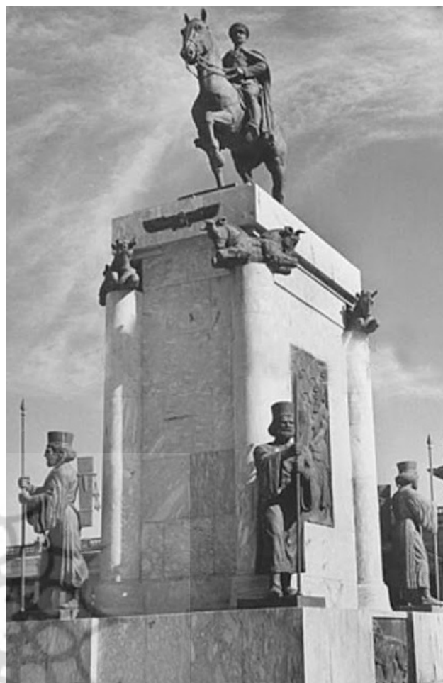
تصویر ۳: مجسمه سواره نظام رضاشاه با تأکید بر الگوهای باستانی، میدان سپه.

نمایش قدرت نظامی و جاه‌طلبی‌ای که اعتمادالسلطنه آن را نفی می‌کند به ظهور می‌رسد. این مجسمه اگرچه اولین بار است که توسط یک ایرانی - میرزا علی اکبر خان معمار - ساخته شد اما نکته جالب توجه آنکه مانند توپ‌ها و ادوات نظامی همچنان به قورخانه سفارش داده می‌شود که وابستگی مفهومی و اجرایی آن را به مقوله جنگ تقویت می‌کند. این مجسمه پابرجا بود تا اینکه «در اوایل دوره پهلوی به دستور بوذرجمهری ذوب و از فلز آن برای ساخت اسلحه استفاده می‌شود» (مهاجر و تاج‌الدینی، ۱۳۹۴: ۱۹۴). بیشترین حضور مجسمه در فضاهای شهری به دنبال کم‌رنگ شدن حرمت شرعی در دوران پهلوی اتفاق می‌افتد و مجسمه‌های فیگوراتیو اسب‌سوار یکی از گونه‌های مهم مجسمه‌های پیکره‌ای این دوران به شمار می‌رود. بعد از اینکه مجسمه ناصرالدین شاه ذوب می‌شود «تا سال ۱۳۱۴ هیچ