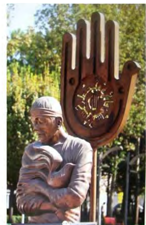
یادمان جانباز میدان هلال احمر

تصویر ۹: استفاده از فرم‌های انتزاعی و عناصر نمادین مفاهیم انقلابی و ارزشی. مأخذ: اسماعیلی، ۱۳۹۱.