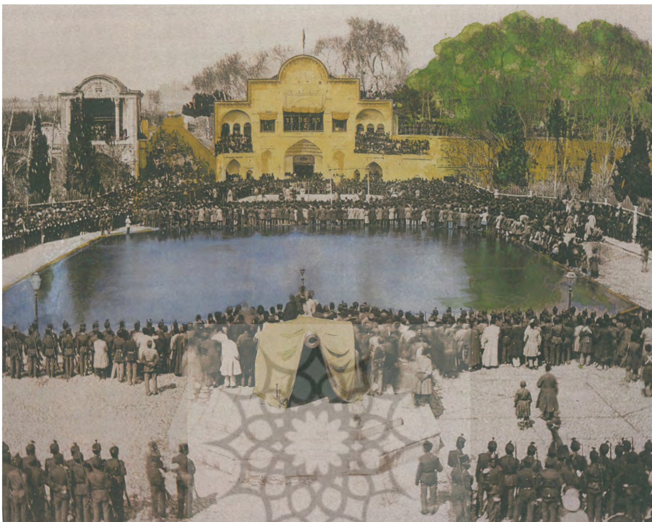
تصویر ۱: توپ مروارید نمونه‌ای از یک حجم شهری که دلالت بر موضوع جنگ دارد. میدان ارگ. مأخذ: جلد مجله منظر، شماره ۳۰، ۱۳۹۴.