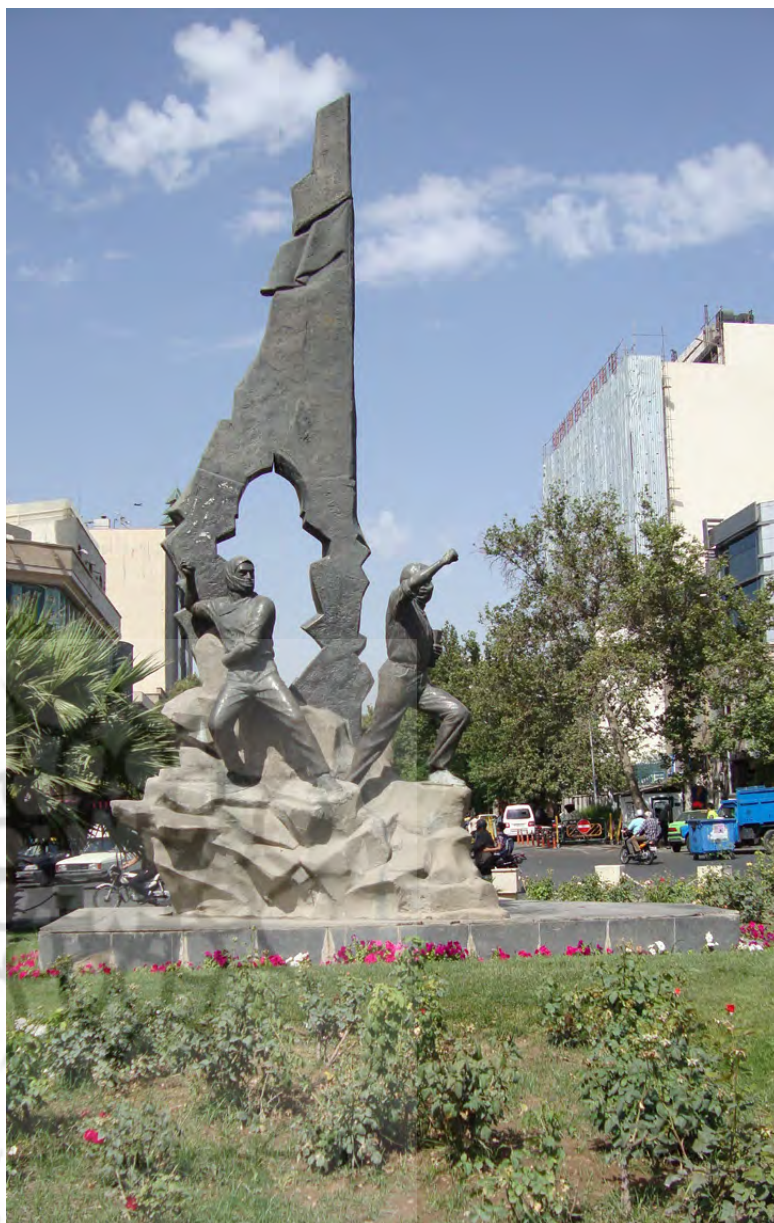
تصویر ۷: اولین مجسمه فیگوراتیو شهری بعد از انقلاب اسلامی که به سوژه جنگ دلالت دارد. میدان فلسطین. عکس: آزاده قلیچ‌خانی، ۱۳۹۴.

در فرم دست‌ها به خصوص در طرح دست امام خمینی (ع) که اشاره به نقش رهبری و حمایت ایشان از مردم در جریان انقلاب داشت؛ اما بعد از آن به مدلول دیگری یعنی روایت هشت سال جنگ تحمیلی و رهبری امام خمینی (ع) در آن سال‌ها ارجاع داشت (۶) (اسکندری، ۱۳۹۴)؛ (تصویر ۶). در دوره جنگ علاوه بر اینکه ساخت مجسمه فیگوراتیو و واقع‌گرا نمادی از حکومت پیشین تلقی می‌شده، تشدید منع شرعی مجسمه بعد از انقلاب اسلامی باعث می‌شود عناصر نمادین انقلاب تعریف شوند: لاله، پرنده، کبوتر. بنابراین حجم‌هایی برگرفته از نمادهای کلی انقلاب در آن سال‌ها توسط هنرمندان ساخته و در میدان‌های شهر نصب شد.