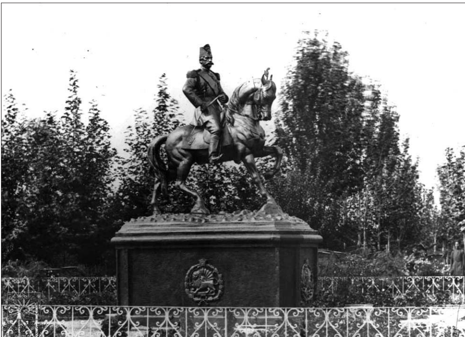
تصویر ۲: مجسمه سواره نظام ناصرالدین شاه اولین نمونه مجسمه شهری فیگوراتیو. میدان باغشاه.

در سوره انفال، آیه ۲۰ می‌فرماید: «هر چه در توان دارید، از نیرو و اسب‌های آماده بسیج کنید، تا دشمن خدا و دشمن خودتان را بترسانید.»