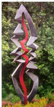
یادمان شهید باهنر میدان شهیدباهنر