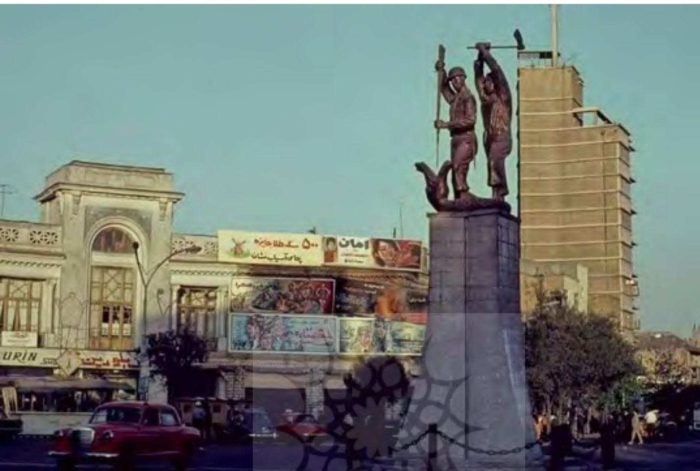
تصویر ۵: نمایش مفاهیم انقلابی و آزادی‌خواهی با بیان اسطوره‌ای. مجسمه میدان مخبرالدوله.

وجود داشت (تصاویر ۴ و ۵). مجسمه‌های این دوران - دوره پهلوی - به‌نوعی مجسمه‌های حکومتی هستند که در فضاهای متعلق به حکومت از جمله میدان نصب می‌شدند. چراکه مجسمه‌هایی در ارتباط با مفاهیم زندگی روزمره در فضاهای فراغتی و فرهنگی چون پارک‌ها، فرهنگسراها و جلوخان تئاترها و محوطه موزه‌ها قرار داشتند. به‌طور کلی موضوع جنگ و مبارزه در مجسمه‌های این دوره را می‌توان تحت تأثیر تجربیات جنگی و انقلاب مشروطه به دو گروه تقسیم کرد: (۱) مجسمه‌هایی که نمایشی از جنگاوری، قدرت نظامی و سلطه‌طلبی رهبران سیاسی و اقتدارگرایی محسوب می‌شوند همچون توپ‌های جنگی و مجسمه‌های پیکره‌ای و سواره‌نظام شاه. (۲) مجسمه‌های نمادین که با بیان اسطوره‌ای و بهره‌گیری از ادوات جنگی چون نیزه و شمشیر نمایشی از مبارزه بر سر مفاهیم عدالت و آزادی هستند. مجسمه‌های پیکره‌ای این دوره بیشتر کارکرد