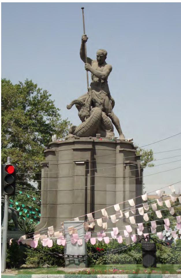
تصویر ۴: نمایش مفاهیم انقلابی و آزادی خواهی با بیان اسطوره‌ای. مجسمه گرشاسب و اژدها.