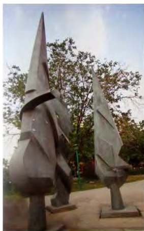
یادمان شهدا بوستان امام علی

مجسمه‌سازی در سال ۱۳۷۲ به رسمیت شناخته می‌شود و دانشجو می‌پذیرد (تصویر ۷). در این دوره همچنین اولین مجسمه شهری از مبارزی انقلابی - شهید آیت‌الله مدرس - در فضای میدان بهارستان (۱۳۷۵) حضور می‌یابد. در دوره چهارم (۱۳۸۰ تا ۱۳۸۹) شاید بتوان با وام‌گیری از این جمله «نیکلاس پرونای» که «تجربه دوران جنگ نشان می‌دهد که یک دهه پس از جنگ، زمان صیقل خوردن خاطرات تلخ فرا می‌رسد. در این هنگام مردم این امکان را می‌یابند که دوباره، اما این بار از طریق نیروی خلاق هنر، با این خاطرات تلخ مواجه شوند» (سورلن به نقل از راودراد و حیران‌پور، ۱۳۹۲: ۵۹) از آن به دوره تثبیت مجسمه‌های شهری با موضوع جنگ و انقلاب تعبیر کرد که مجسمه‌سازی شهری به صورت جدی به این مقوله می‌پردازد، اما نکته‌ای که این گفته را نقض می‌کند آن است که مجسمه‌های شهری تهران شکلی واقعی از روایت جنگ نیستند و مصائب جنگ و خاطرات تلخ را در نظر ندارد؛ برخلاف کشورهای دیگر که به نمایش تجاوزات و مصائب مختلف دوران جنگ می‌پردازند. در این دوره همان‌طور که گفته شد از خلال مفاهیم انقلاب و نگاه جدید به مقوله جنگ حماسه‌سازی قهرمانان جنگ و قهرمان‌سازی فرماندهان و تکریم و بزرگداشت آن‌ها با ساخت مجسمه، سردیس و نیم‌تنه آن‌ها همراه است (تصویر ۸). لازم به ذکر است موضوع شهید فقط به شهدای جنگ ایران و