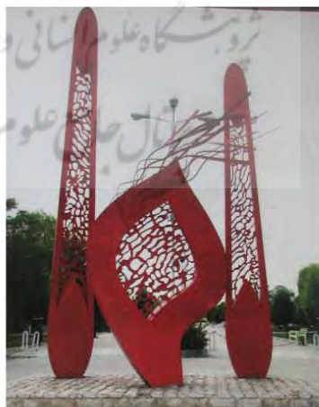
یادمان شهدا بوستان بهمن