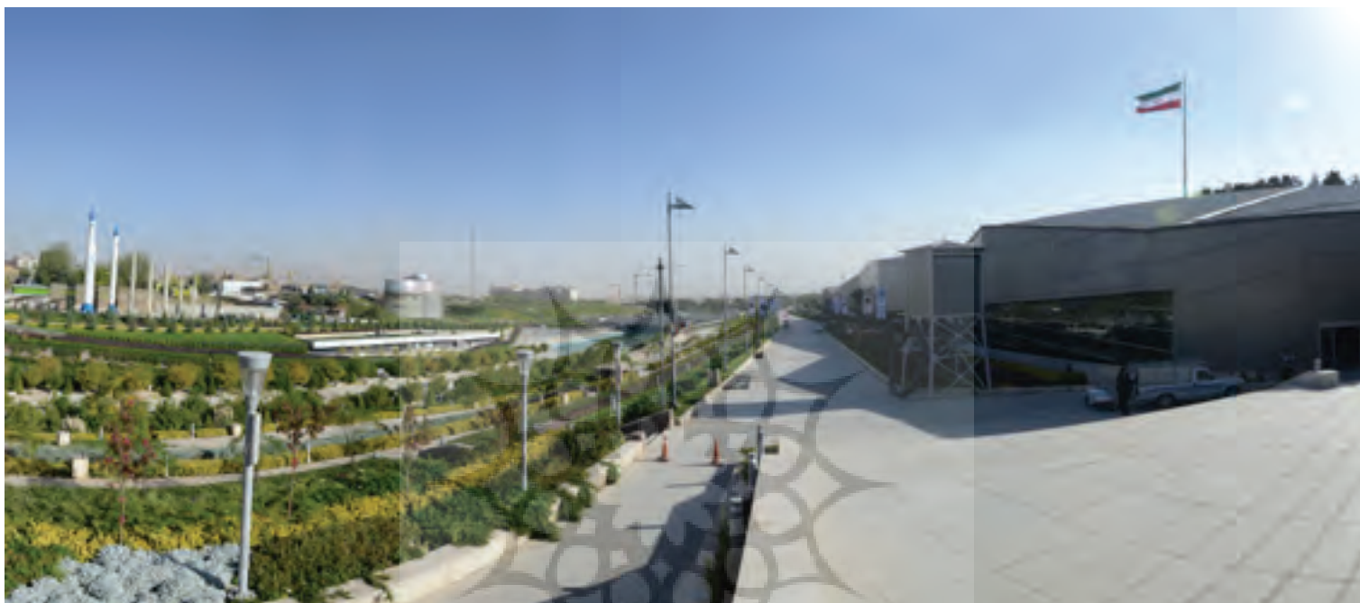
تصویر ۳ Pic3

Pic3: Garden Museum a base of lines for layout elements. Holy Defense Garden Museum, Tehran. Photo: Mehdi Dorkhah, 2011.