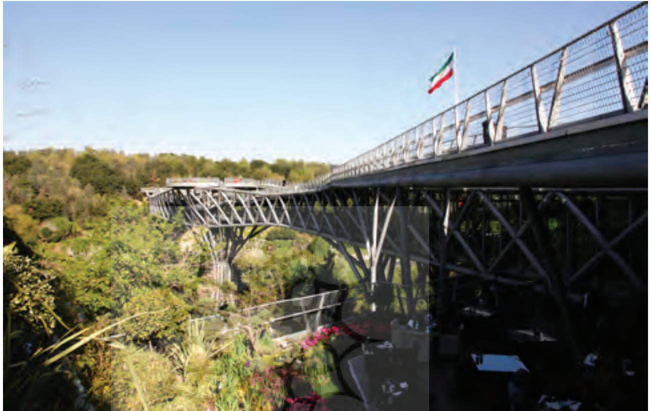
تصویر ۴ Pic4

Pic4: The massive steel bridge among the nature.