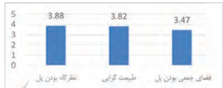
نمودار ۲: نمودار مقایسه معیارهای ارزیابی پل طبیعت در بازه‌های سنی تعریف شده. Diagram2: The diagram of comparison of bridge evaluation criteria in defined age ranges.