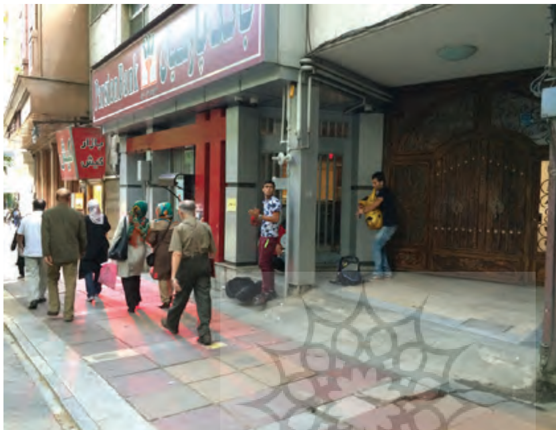
تصویر ۳: محل استقرار نوازندگان در مسیر پیاده خیابان ولیعصر، تجریش، عکس: آناهیتا مدرک، ۱۳۹۴.

Pic3: Street musicians' settling place in Valiasr pedestrian sidewalk. Photo: Anahita Modrek, 2015.