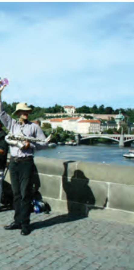
تصویر ۱: اجرای موسیقی خیابانی بر روی پل تاریخی چارلز در شهر پراگ. عکس: مونا مسچی، ۱۳۹۴.

Pic1: Street music performance on Charles historic bridge in Prague. Photo: Mona Meschi, 2015.