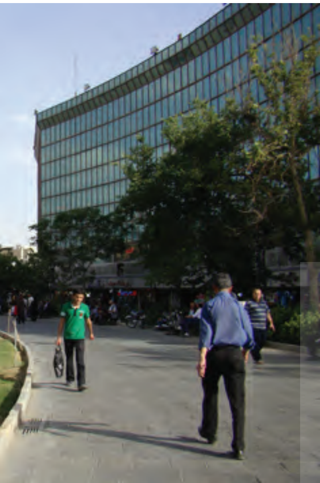
تصویر ۸: عدم تناسب مقیاسی و گونه گیاهان استفاده شده در طرح کاشت.