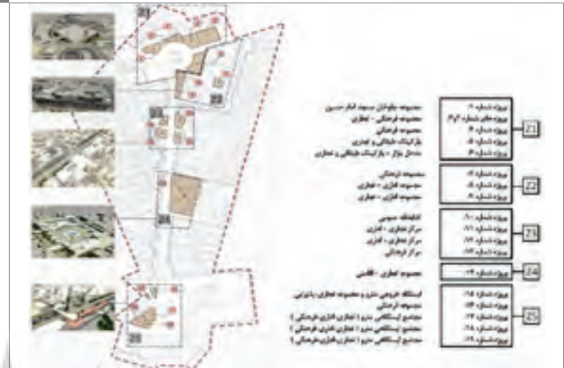
تصویر ۶ Pic6

Pic6: The vegetation of -17Shahrivar Street.