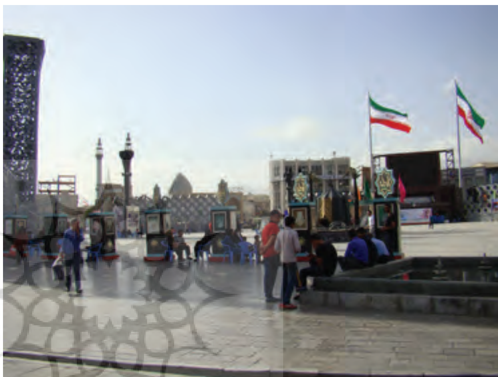
تصویر ۸ Pic8

design, implementation and feedback. Environmental intervention could not be the result of thought and values of a small crowd of programmers, designers or administrators, but it is necessary to form based on a transparent, reasonable, rational and participatory process. The relationship between man and man-made urban-environment space is a civil relationship in which the quality shapes the audience behavior patterns. Improving quality, creating a reasonable balance between the different roles of urban areas and focusing on the role of civil society ensures the survival of this relationship. The impact of management factor on the process of implementing a project should never be ignored. In the process of improving the quality of place, going out of daily decisions, and taste-based policies environment which will reversely lead to the reduction of qualitative values; Strategic