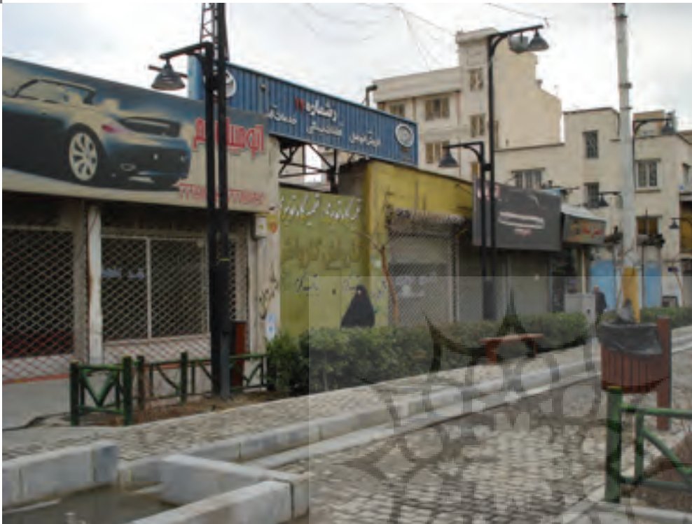
تصویر ۴: تعطیلی واحدهای تجاری به دلیل مداخلات بدون پشتوانه برنامه‌ای و جذب مشارکت مردم. عکس: فهیمه فرنوش، ۱۳۹۳.

Pic4: The closure of commercial units due to the intervention without the program support and attraction of public participation. Photo: Fahimeh Farnoosh, 2014.