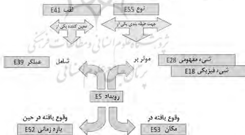
شکل ۱. ساختار اصلی مدل مرجع مفهومی سازمان بین‌المللی مستندسازی (لبوف و پلگرین، ۲۰۱۴)

همان‌گونه که ذکر شد، پرس آ مدلی شی گراست و گسترشی از مدل اف آر بی آر ۱ به‌شمار می‌آید که مفاهیم کلیدی موجود در مدل‌های خانواده ملزومات کارکردی (اف آر) نیز در آن وجود دارد. مدل پرس آ برخلاف اف آر بی آر ۲ که فقط یک طبقه‌بندی ۳ دارد می‌تواند طبقه‌بندی‌های متعددی از جمله تاریخچه (ویژگی‌های خاص شماره‌های نشریات)، سیر تحول و پیچیدگی‌ها، تفکیک‌ها، جایگزینی‌ها، ذخیره‌سازی اشیای فیزیکی، شرایط صحافی، و غیره را دربرگیرد. این گسترش اف آر بی آر، یک هستی‌شناسی قراردادی است که برای نشان دادن اطلاعات کتابشناختی ۴ مربوط به پایندها طراحی شده است. در واقع، پرس آ شرح و تفصیلی از مفاهیمی است که در اف آر بی آر ۵ مدل‌سازی شده بود و براساس محتوای مدل مرجع ۶ مفهومی سازمان بین‌المللی مستندسازی فرمول‌بندی شده است. برای درکی صحیح از پرس آ لازم است با مشخصات اصلی این دو مدل آشنایی داشته باشیم. مدل [مفهومی] مرجع، مدلی شی گراست که از سال ۱۹۹۶ توسعه داده شد. این مدل رویدادمحور ۷ است و توصیف هر شی بر زنجیره‌ای از رویدادهای مرتبط و ویژگی‌های آن شی متمرکز می‌شود (لبوف و پلگرین، ۲۰۱۴).