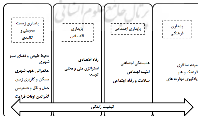
شکل ۱- چهارچوب مفهومی کیفیت زندگی (مأخذ: فرجی‌ملانی، ۱۳۸۹- الف)

با توجه به پیچیدگی مفهوم کیفیت زندگی، چهار رکن اساسی، مفهوم کیفیت زندگی شهری را در بر می‌گیرد. این چهار رکن عبارتند از: پایداری اقتصادی، پایداری اجتماعی، پایداری محیطی و پایداری فرهنگی (رهنمائی و همکاران، ۱۳۹۱: ۵۰).