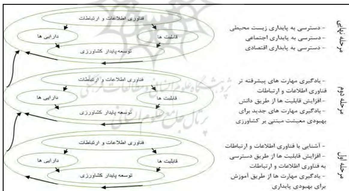
شکل شماره (۱): مدل نظری پژوهش

از مزایای فناوری اطلاعات و ارتباطات برای انتخاب بهترین راه حل، نظام‌های مؤثر برای مدیریت آب، آبیاری برای افزایش حداکثر تولید آگاه هستند. همچنین فناوری اطلاعات و ارتباطات می‌تواند باعث گسترش کشاورزی الکترونیک ۱ برای انتقال اطلاعات فرآیند بازاریابی و بهبودی کسب و کار، بهبود کیفیت زندگی روستاییان و در نهایت توانمندسازی جامعه روستایی گردد (Pande and Deshmukh, 2015:32). بررسی یافته‌های ایکون کو ۲ و همکارانش (۲۰۱۵)، در زمینه نقش فناوری اطلاعات و ارتباطات مخصوصاً تلفن موبایل در حمایت از کشاورزان نیجیریه نشان می‌دهد که کشاورزان بیشتر از طریق تلفن موبایل به اطلاعات کشاورزی دسترسی پیدا می‌کنند و اطلاعات در زبان محلی برای کشاورزان منتقل می‌گردد، این فرآیند انتقال اطلاعات باعث بروز شدن اطلاعات گردیده و زمانی که این فرآیند به طور موفق کرده منجر به بهبودی تولیدات و در نهایت توانمندسازی کشاورزان گردیده است (Okonkwo et al, 2015:9). بر مبنای مبانی نظری و ادبیات موضوع که به طور خلاصه ارائه گردید، رویکرد نظری پژوهش حاضر بر اساس مدل مفهومی ارائه می‌شود (شکل ۱). بر اساس این مدل، فرض اصلی این است که مؤلفه فرآیند توسعه فناوری اطلاعات و ارتباطات با تمامی ابعاد و شاخص‌های آن در یک فرآیندی بر مؤلفه توسعه پایدار کشاورزی اثر گذار است.