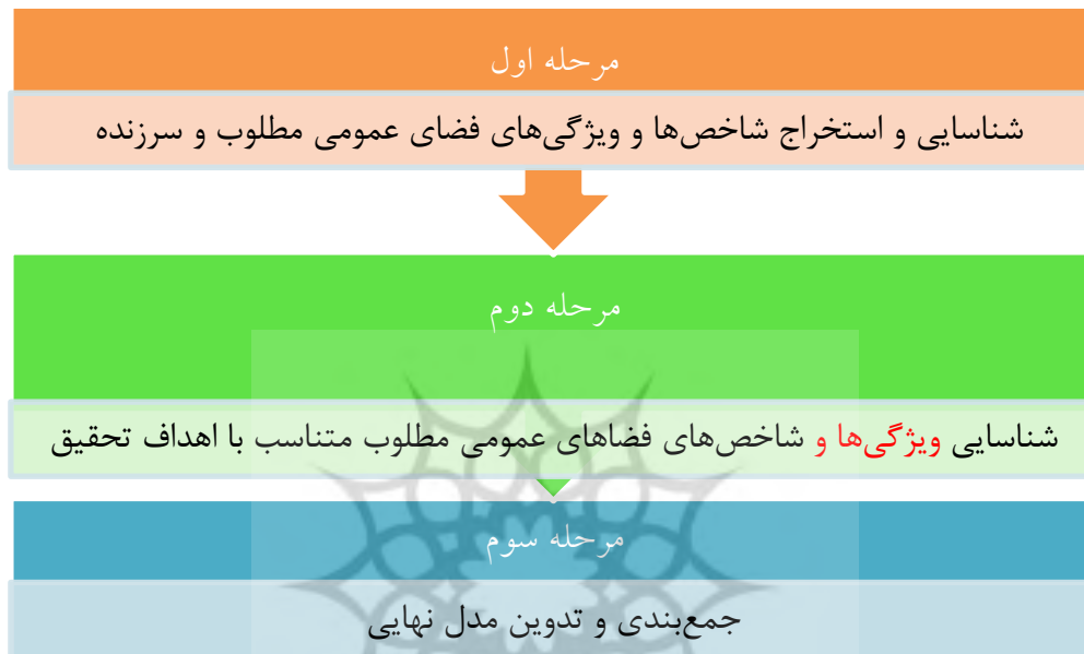
شکل ۱. فرایند کلی پژوهش

فرایند اصلی این پژوهش، سه مرحله است که در شکل ۱ ترسیم شده است.