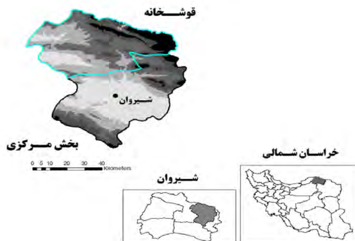
تصویر ۳. نقشه ناحیه مطالعه‌شده.