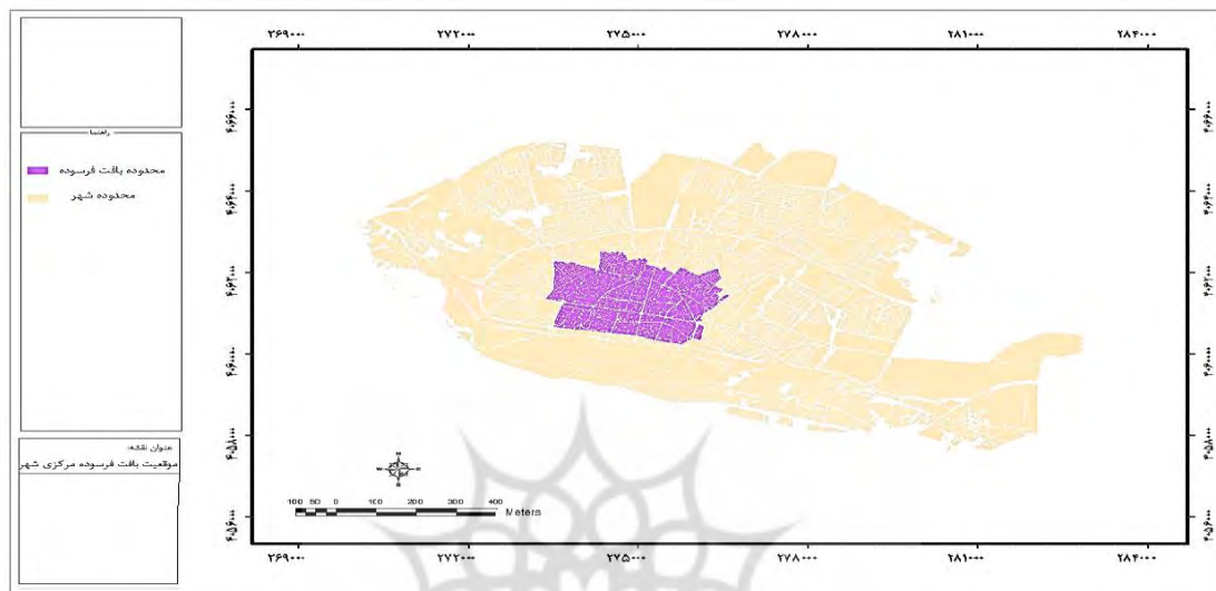
نقشه ۱. موقعیت بافت فرسوده شهر زنجان

حیات شهری در این نواحی را به‌همراه داشته است (حیدری و دیگران، ۱۳۹۳: ۹۵). وجود بافت تاریخی و برخورداری از آثار و بناهای بارز تاریخی، فرصت‌های مناسبی برای ایجاد رونق و حیات در بافت تاریخی شهر با زمینه‌سازی برای ورود گردشگران به این بافت ایجاد می‌کند. بهره‌برداری مناسب از این فرصت‌ها، به بهسازی و نوسازی بافت فرسوده- که بافت تاریخی شهر را نیز دربرمی‌گیرد- کمک شایانی می‌کند و فرایند تجدیدحیات این قسمت از شهر را تسهیل و تسریع می‌سازد (مشکینی و دیگران، ۱۳۸۷: ۱۱۹).