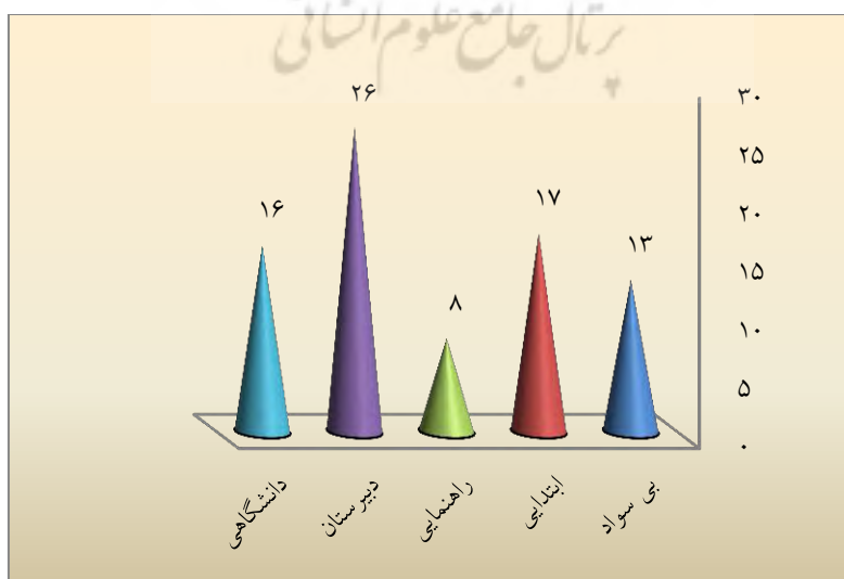
شکل ۲. فراوانی سطح تحصیلات مشارکت‌کنندگان محلی در برنامه‌های گردشگری (n=۸۰)

از ۸۰ فرد مورد مطالعه، ۶۱ نفر (۷۶/۲۵ درصد) مرد و ۱۹ نفر (۲۳/۷۵ درصد) زن هستند. حضور بالای ۲۰ درصدی زنان نشانگر سطح مناسب مشارکت زنان منطقه در فعالیتهای مربوط به گردشگری است. از میان جمعیت نمونه، ۵۳ نفر (۶۶/۲۵ درصد) متأهل و ۲۷ نفر (۳۳/۷۵ درصد) مجردند. شکل ۲ وضعیت سواد را در افراد مورد مطالعه نشان می‌دهد. همان‌گونه که از شکل پیداست، مردم محلی با سطح تحصیلات متفاوت، در برنامه‌های مرتبط با گردشگری مشارکت داشته‌اند و البته بیشترین سطح مربوط به افراد با تحصیلات دیپلم است. این امر نشانگر سطح تحصیلات مردم محلی مشارکت‌کننده در فعالیتهای گردشگری در این منطقه نیز است. وجود افراد تحصیل کرده، یکی از مهم‌ترین ویژگی‌های جوامعی است که مستعد بسط و گسترش فضای کارآفرینی هستند.